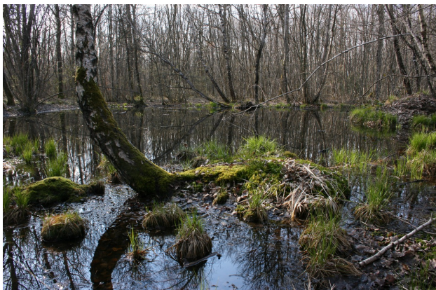
Mare forestière naturelle recreusée et débroussaillée abritant neuf espèces d'amphibiens