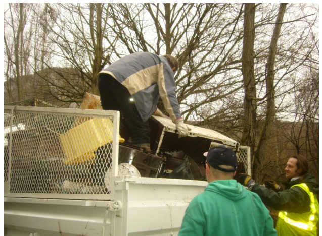
Ramassage d'ordures à l'Oratoire - Photo Didier Besson

Dispositif de protection amphibiens - Photo Didier Besson