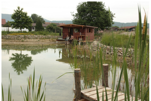
Mare artificielle, présence de six espèces d'amphibiens

Une démarche qui plaira certainement aux nombreux hôtes de votre jardin et pour laquelle la LPO ne manquera pas de vous aider et de vous conseiller.