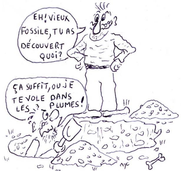
Dessin Jean-Charles Million