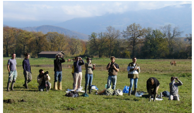
Chantier Guidou - Pause déjeuner