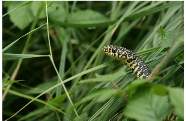
Couleuvre verte et jaune

Herpéto 74 : mieux connaître la répartition des espèces les plus méconnues ou les plus fragiles pour mieux les protéger. Le Crapaud calamite, l'Alyte accoucheur, le Sonneur à ventre jaune ou encore les Couleuvres verte et jaune et d'Esculape en sont de bons exemples ; ces espèces constituant de surcroît de bons indicateurs de la santé du milieu naturel ! De cette amélioration de la connaissance découlera, entre autre, la réactualisation de l'atlas des reptiles et amphibiens de Rhône-Alpes, outil indispensable pour l'aménagement du territoire et la protection des espèces aux échelles régionale et départementales.