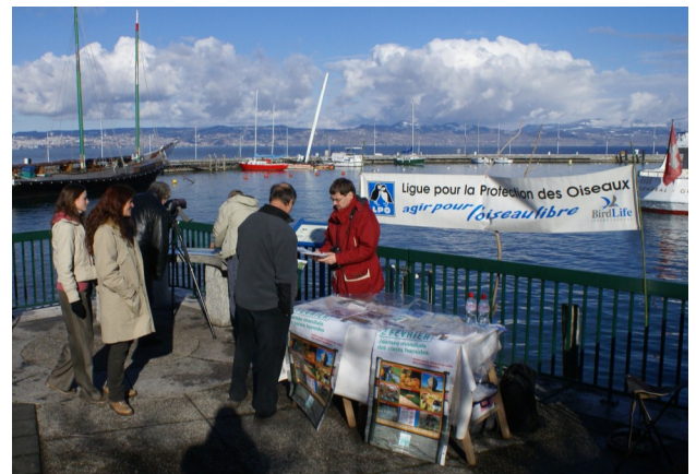
Stand lors de la Journée Mondiale des Zones Humides