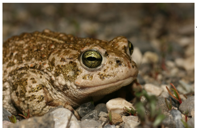
Crapaud calamite