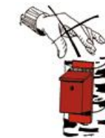
Ne pas déranger la nichée