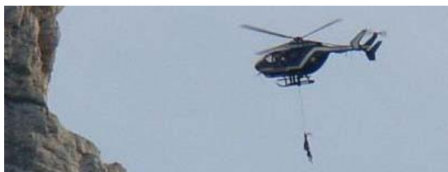
Hélicoptère d'un bouquetin mâle adulte abattu Le Reposoir

Le Ministère de l'Écologie, sous la pression de la filière agricole et d'un certain nombre d'élus, a finalement décidé de faire procéder à un abattage sanitaire des individus statistiquement les plus touchés, à savoir les adultes (mâle et surtout femelles) de cinq ans et plus. Or, les individus dans cette tranche d'âge sont les plus nombreux dans le Bargy, car la population de ce massif est âgée à cause de performances reproductives très basses au regard de celles constatées dans d'autres massifs alpins. Mais tous les bouquetins de cette tranche d'âge ne sont pas infectés, et une proportion significative parmi eux est saine ou plutôt était saine car tous ont été abattus !