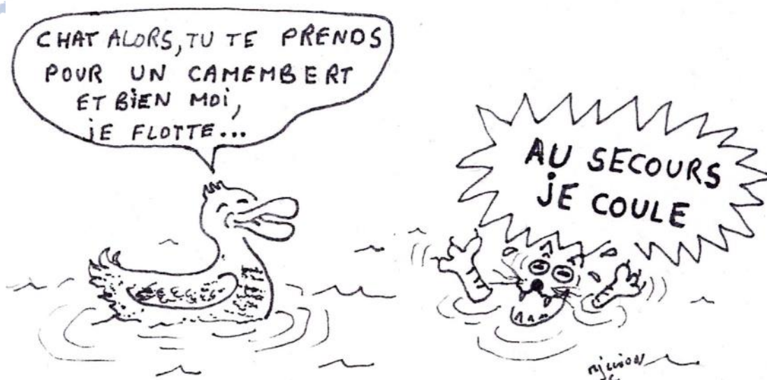
Dessin J.-C. Million

Une équipe de biologistes canadiens de Toronto a tenté de répondre à cette question il y a quelques années. Ils ont procédé à l'analyse d'animaux morts ou vivants, dans le but d'identifier les différents éléments contribuant à assurer la flottabilité des canards. Selon leurs conclusions, la faible densité corporelle mesurée chez les anatidés résulte principalement d'une caractéristique anatomique : l'existence de sacs aériens qui alimentent les poumons selon le principe de soufflets. Par ailleurs, le plumage renferme un volume d'air considérable et le squelette et les plumes présentent une structure allégée. Autant de