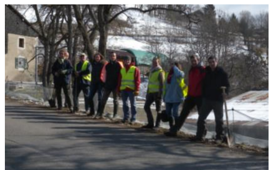
Installation du dispositif de protection à Bogève