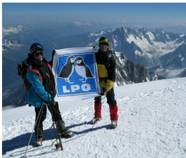
La LPO au sommet du mont Blanc

La LPO renforce ses liens en hissant ses couleurs au sommet du mont Blanc. Suite à de mauvaises conditions météorologiques rencontrées lors de l'ascension 2012 organisée dans le cadre du Centenaire de l'association, bénévoles, administrateurs et salariés de la LPO se sont retrouvés le week-end des 20 et 21 juillet 2013 pour gravir à nouveau le plus haut sommet des Alpes. Cette démarche symbolique rend compte de l'énergie et de la volonté de développement qui anime notre association, représentante française de l'organisation mondiale Birdlife international. Cent ans d'action pour atteindre des sommets, beaucoup d'énergie mobilisée, de splendides victoires, mais que de travail encore à accomplir pour qu'enfin la biodiversité soit prise en considération dans les décisions politiques. Au-delà des discours prometteurs, il est temps d'agir. Il en va de l'avenir de l'Humanité.