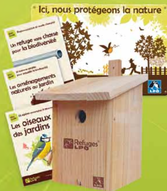
Coffret Refuge jardin