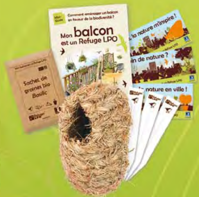
Coffret Refuge balcon

Gagnez du temps : inscrivez-vous en ligne sur http://monespace.lpo.fr