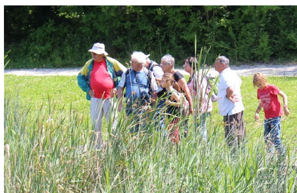
Libellule à quatre taches et balade au bord des plans d'eau

L'année prochaine, rendez-vous le Dimanche 31 Mai !