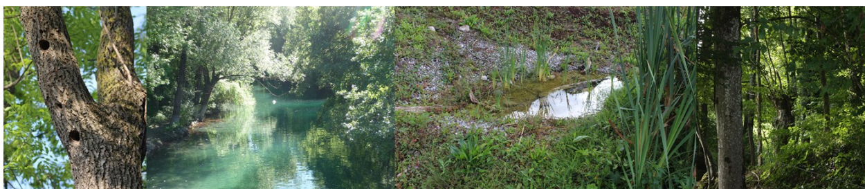
Boisement et zones humides des refuges LPO de Haute-Savoie

Les bois, bosquets et autres milieux forestiers sont également à l'image de notre département, bien représentés au sein des Refuges LPO. Que se soit dans les ripisylves du Fier, du Chéran ou de l'Arve, ou au cœur des forêts de montagne du Semnoz, passereaux, mammifères et insectes animent les branches et la cime des arbres de nos forêts. Ici, tout est productif et la moindre branche morte peut devenir un logement ou un garde-manger pour la faune sauvage.