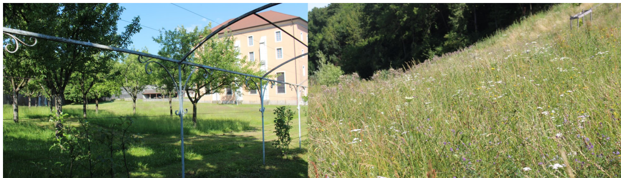
Photo : verger du conservatoire d'Art et d'Histoire d'Annecy et prairie du Vernand à Annemasse

Les milieux agricoles comme les prairies et les vergers sont assez fréquents sur les refuges LPO. D'une importance capitale pour les invertébrés, dont notamment les insectes pollinisateurs comme les papillons et les abeilles, ils accueillent également de nombreuses espèces d'oiseaux dont les populations sont souvent en baisse à l'échelle nationale. Pour ces milieux, le mot d'ordre est « patience ». Il faut laisser le temps à la nature de vivre et de se reproduire pour qu'elle puisse, chaque année, nous offrir son ballet coloré de fleurs et d'insectes.