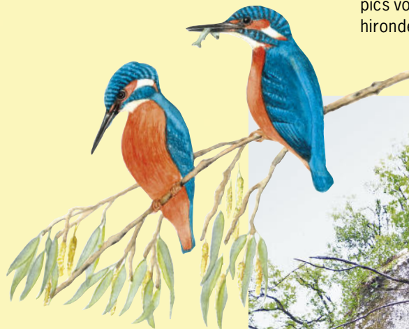
Martins-pêcheurs d'Europe Dessin : Véronique Gauduchon

La pierre folle - Photo : Philippe Doyen