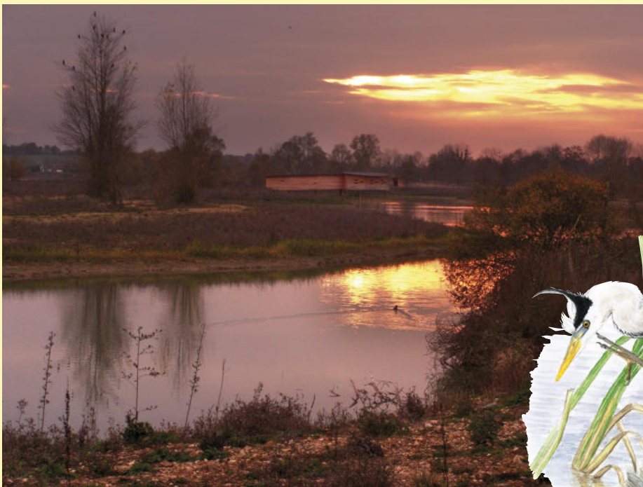
Héron cendré. Dessin : Katia Lipovoi - La réserve ornithologique au crépuscule.

Reprenez le chemin (5) qui borde le lac. Les arbres de l'îlot rassemblent une centaine de grands cormorans hivernants alors que quelques anatidés se réfugient sur le rivage. La ripisylve abonde de mésanges bleues, charbonnières ou à longue-queue, de pinsons des arbres et parfois du Nord... Depuis l'observatoire (6), suivez les évolutions des grèbes huppés en pêche... La gallinule-poule d'eau se montrera-t-elle ? Dans les pelouses proches du golf, merles noirs, grives draine et litorne trouvent leur pitance. La base de voile (7) offre le meilleur point de vue sur le lac. En fin d'après-midi, des milliers de mouettes rieuses, accompagnées de quelques dizaines de goélands, se rassemblent sur l'eau pour y passer la nuit en toute sécurité. Une tempête océanique s'annonce ? Guettez les plongeurs, harles, macreuses, garrots à œil d'or rejetés malgré eux sur le plan d'eau... Près de la presqu'île des pêcheurs (8), observez entre autres passe-reaux les bruants jaune et zizi, et repérez le moustachu pic vert au sol, en quête de nourriture, tout près du camping (9). Dernier coup de jumelles sur le lac (10) avant de rallier votre point de départ, la boucle est bouclée... N'oubliez pas de transmettre vos observations à la LPO Vienne ! ■