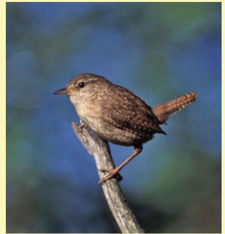
Troglodyte mignon.

(4) Dans la descente, la bouscarle de cett lance son cri d'éclat. En contrebas dans la vallée, vous pouvez apercevoir le site gallo-romain de Sanxay. Arrivé à la D3, prenez à gauche, traversez le pont, tournez à droite après le village « Moulin de Pouvreau » en direction du Bois Lentier, jusqu'à la Croix Barrée. (5) Sur ce plateau, vous pourrez observer à l'occasion les bruants jaune et zizi, mais aussi surprendre l'épervier en quête d'une proie. Au carrefour de la Croix Barrée, prenez le chemin de gauche, coupez le GR 364, suivez une petite route sur 500 m, puis dans le virage, quittez cette route en continuant tout droit, jusqu'à l'ancien chemin de Rochelle. (6) Tournez à gauche en direction de la ferme Malépine,