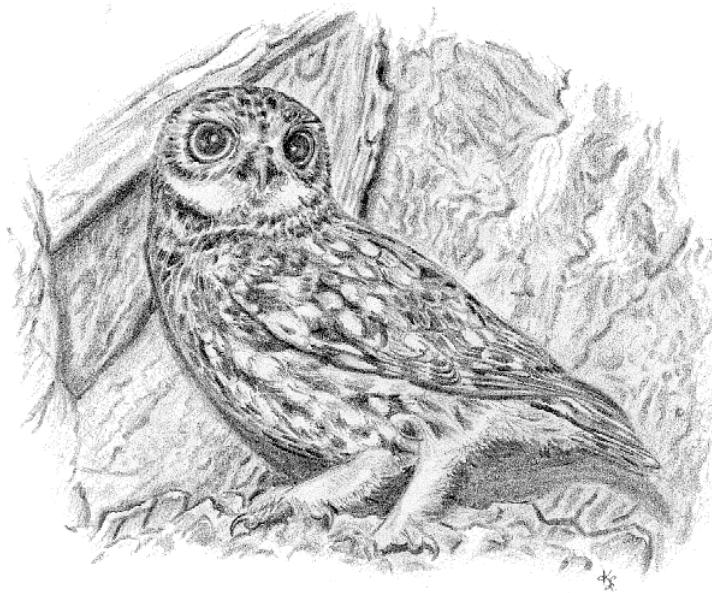
Chevêche d'Athéna (Dessin K. Lipovoï)

Tucker G.M. et Heath M.F. 1994. Birds in Europe: their conservation status . Birdlife International, Cambridge, UK.