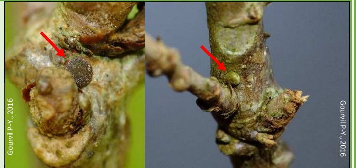
Œufs de Satyrrium ilicis juste après la ponte (à gauche) et en fin d'hiver

Œufs pondus généralement à moins de 20 cm du sol. Autres plantes-hôtes (moins fréquentes) : Orme ( Ulmus minor ) et Prunellier ( Prunus spinosa ).