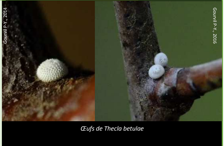
Œufs de Thecla betulae

Autres plantes-hôtes : Prunus padus , P. domestica (Pruniers), P. armeniaca (Abricotier), P. persica (Pêchers), P. avium (Merisier).