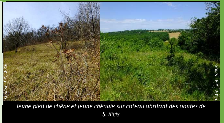
Jeune pied de chêne et jeune chênaie sur coteau abritant des pontes de S. ilicis

Tous les milieux où poussent de jeunes pieds de chênes.