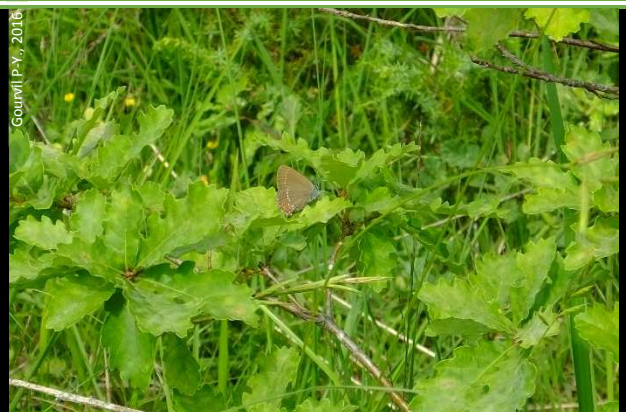
Femelle de S. ilicis sur un pied de chêne avant la ponte

Il faut inspecter minutieusement les pieds pour les découvrir.