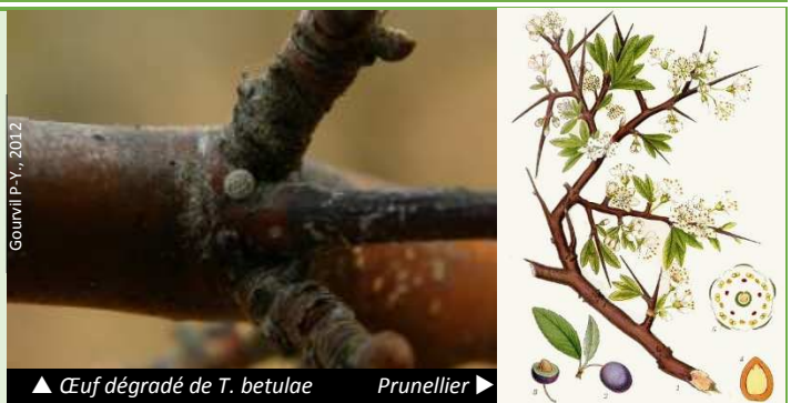
▲ Œuf dégradé de T. betulae

Attention ! Plus on avance dans l'hiver et plus les œufs se dégradent et peuvent perdre leur blancheur.