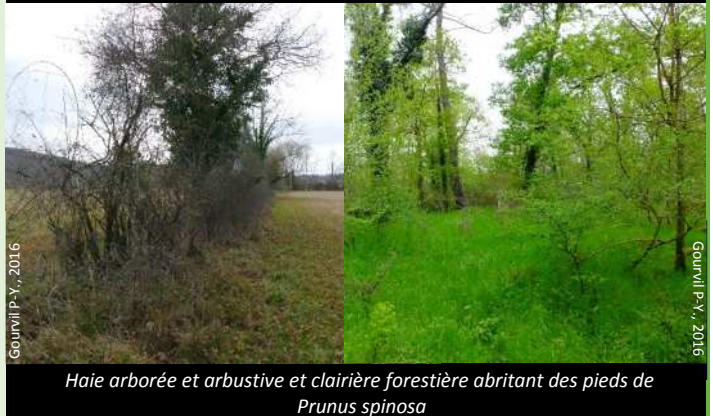
Haie arborée et arbustive et clairière forestière abritant des pieds de Prunus spinosa

Recherchez de préférence les jeunes repousses de Prunellier ou les jeunes branches sans lichens.