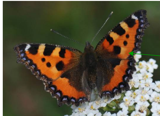
Pas de tache noire