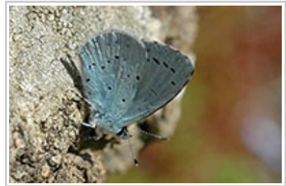
Celastrina argiolus P. Walravens