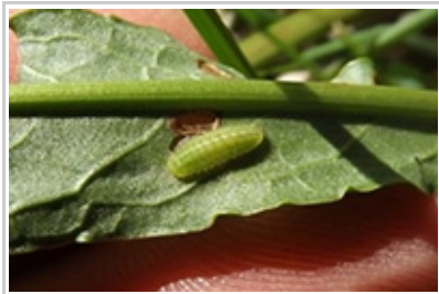
Lycaena Dispar Anne et Pierre Rigaud

Azuré de Chapman (de l'Esparcette) ( Polyommatus thersites ) : 6 données sur 4 sites du 43. Espèce très peu notée. 4 données de Pascal Peyrache le 05/05 et 27/05 à Bournoncle-Saint-Pierre et Beaumont et 2 données de Didier Perrocheau le 27/05 à Saint-Germain-Laprade et le 28/05 à Chadron.