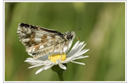
Pyrgus armoricanus D. Perrocheau

Cuivré des marais ( Lycaena dispar ) : 1 donnée de chenille de Anne et Pierre Rigaud le 07/04 à Saint-Diery (63).