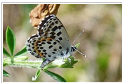
Scolitantides orion B. Gilard