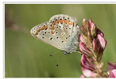
Polyommatus thersites D. Perrocheau

Moyen Argus (Azuré du Genêt) ( Lycaeides idas ) : 1 donnée de Thibault Brugerolle le 28/05 à Mirefleurs (63).