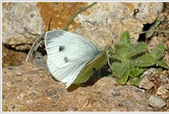
Pieris Manni