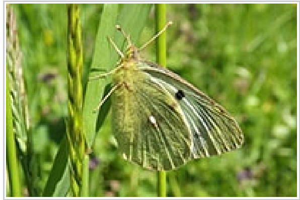
Colias croceus f. helice