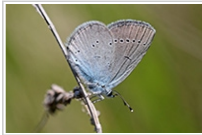
Cupido osiris P. Peyrache