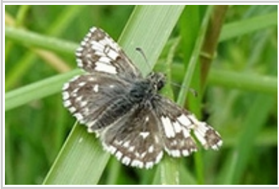
Pyrgus malvae « Taras » S. Heinerich

Lucine ( Hamearis lucina ) : 8 données. 1ère observation tardive de Bruno Gilard le 05/05 à Ally (43) probablement par manque de prospections.