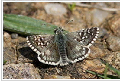
Pyrgus onopordi P. Peyrache