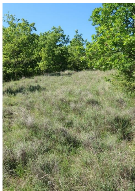
Pelouse sèche de la Baume-Cornillane (26)

Habitats plus diversifiés: divers milieux ouverts (pelouses sèches, prairies, etc.)