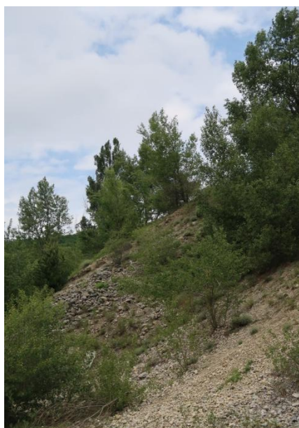
Carrière de Châteaudouble (26)

Vit dans les éboulis, pierriers, zones rocheuses ainsi que sur les landes et pelouses de montagnes jusqu'à 1500m