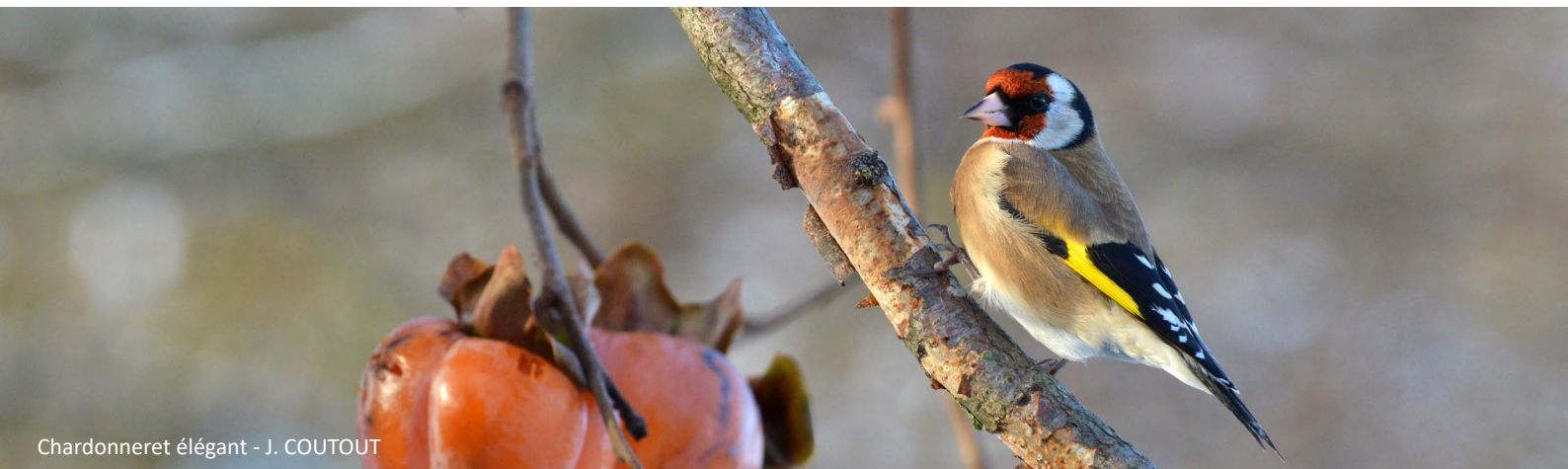
Chardonneret élégant - J. COUTOUT