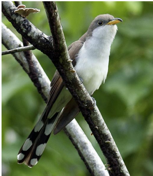
→ Coulicou à bec jaune