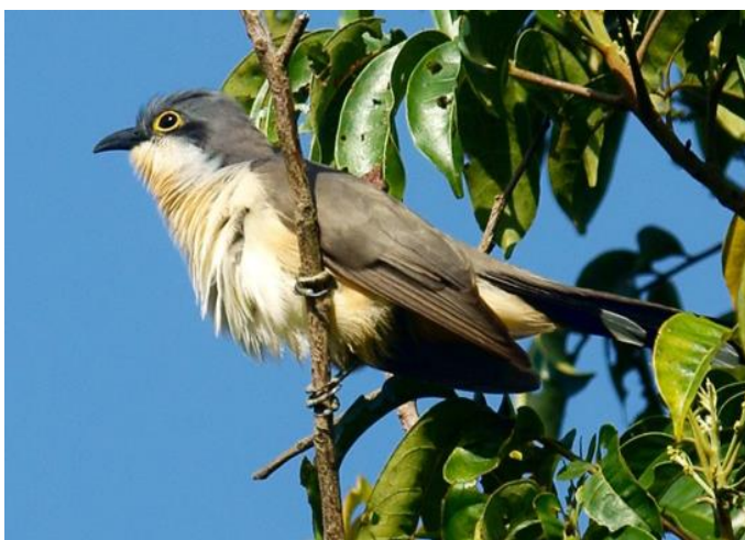
→ Coulicou de Vieillot