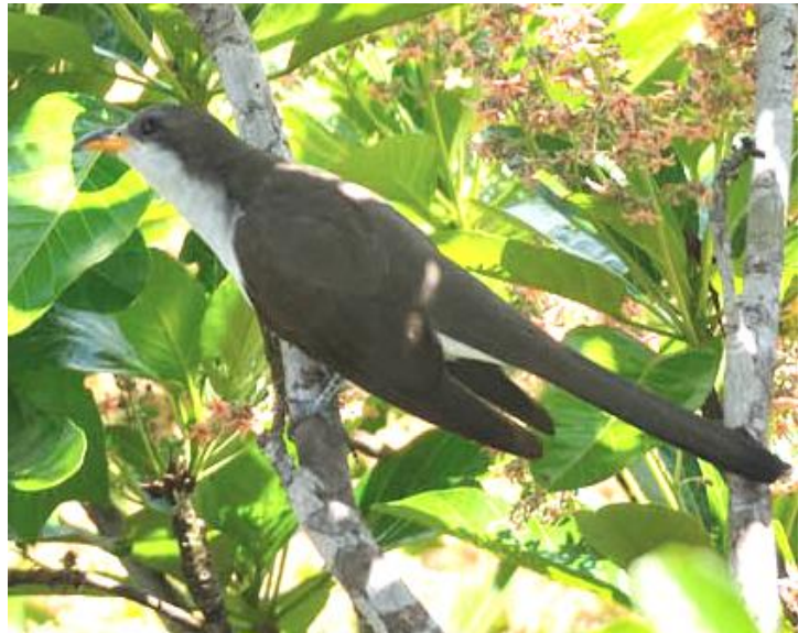
→ Coulicou d'Euler