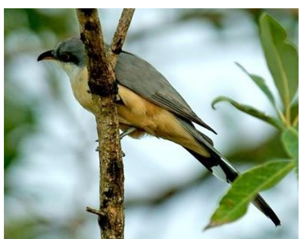
→ Coulicou manioc