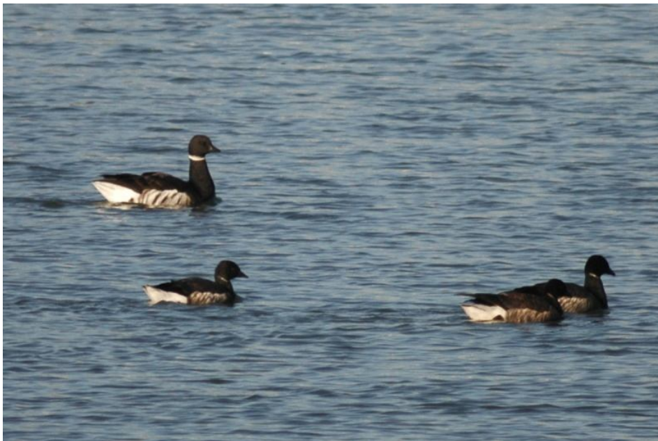
Bernache cravant du Pacifique, baie de Pen Bé / Assérac (Olivier Marié)

1 adulte mâle probable du 05/12 au 17/02/10 dans les traicts du Croisic (Willy Raitière), 1 adulte mâle probable du 07/11 au 22/03/10 dans la baie de Pen Bé / Assérac (Olivier Marié, Alain Gentric).