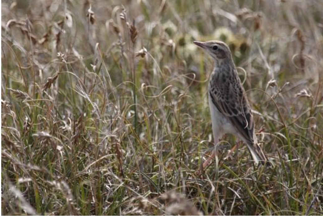
Pipit rousseline, dune de Pen Bron / La Turballe (Aymeric Mousseau)

Bergeronnette printanière ( Motacilla flava ) :