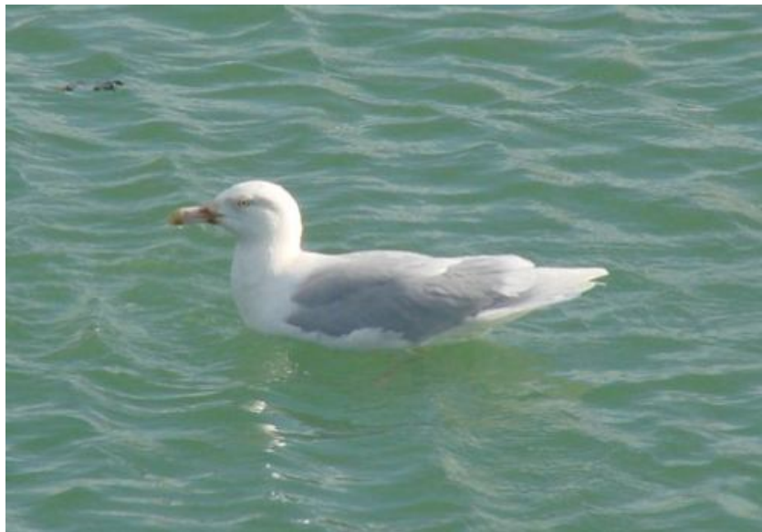
Goéland bourgmestre, port de La Turballe (Gabriel Couroussé)

Au total, ce sont 8 oiseaux différents qui ont été découverts entre le 25/01 et le 22/03.