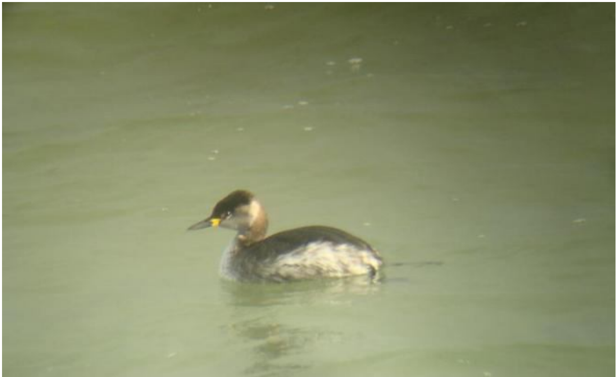
Grèbe jougris, jetée du Tréhic / Le Croisic (Julien Mérot)

1 ad le 25 et 26/01 observé depuis la jetée du Tréhic / Le Croisic (Yves Désaunay, Yann Brilland, Julien Mérot), 1 le 26/10 sur la station d'épuration de Livéry / Guérande (Olivier Marié), 1 du 03 au 08/12 entre la jetée du Croisic et le port du Croisic (Vincent Tanqueray, François Roche et al.).