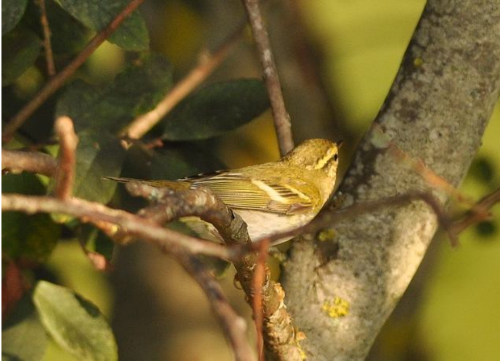
Pouillot à grands sourcils, Lyarne / Les Moutiers-en-Retz