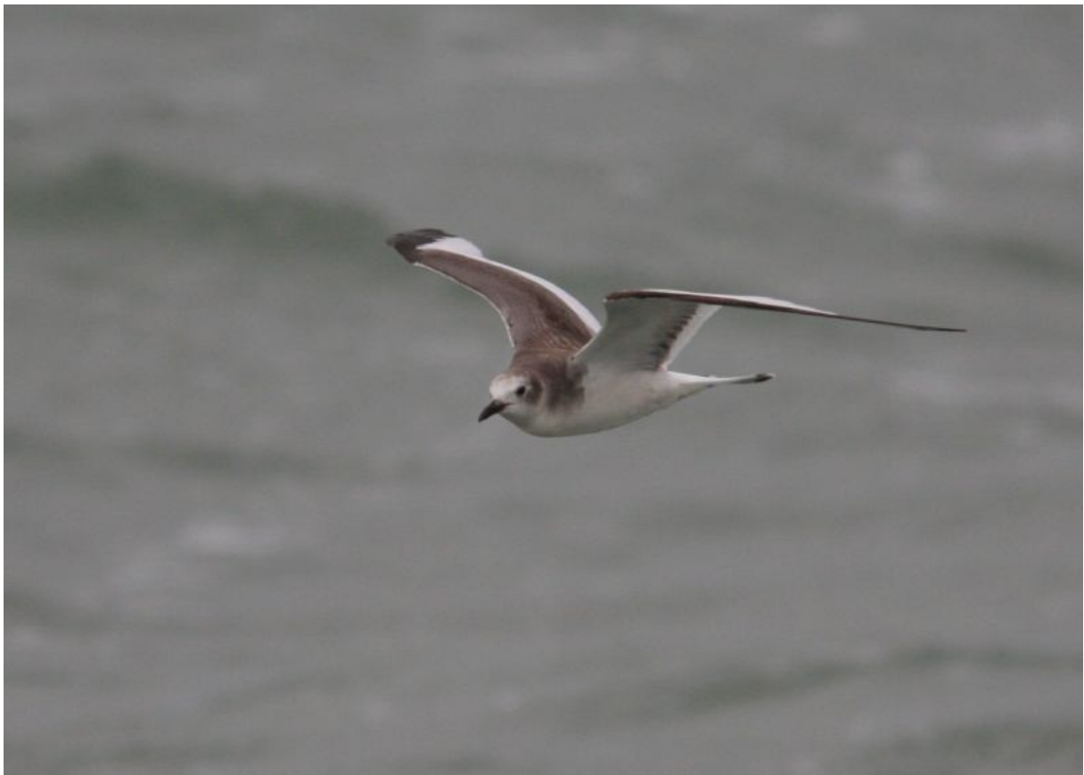
Mouette de Sabine, port de Piriac-sur-mer (Gérard Bertiau)

2 dont 1 immature passent en vol devant la pointe du Croisic le 01/11 (Olivier Marié), un oiseau de 1 re année le 22/11 devant le port de Piriac-sur-mer (Gérard Bertiau).