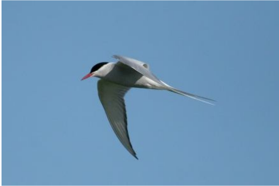
Sterne arctique, Traict de Mesquer (Willy Raitière)