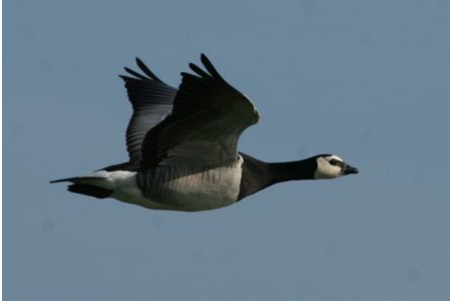
Bernache nonnette, étang de Beaumont / Issé

Bernache cravant à ventre pâle ( Branta bernicla hrota ) :