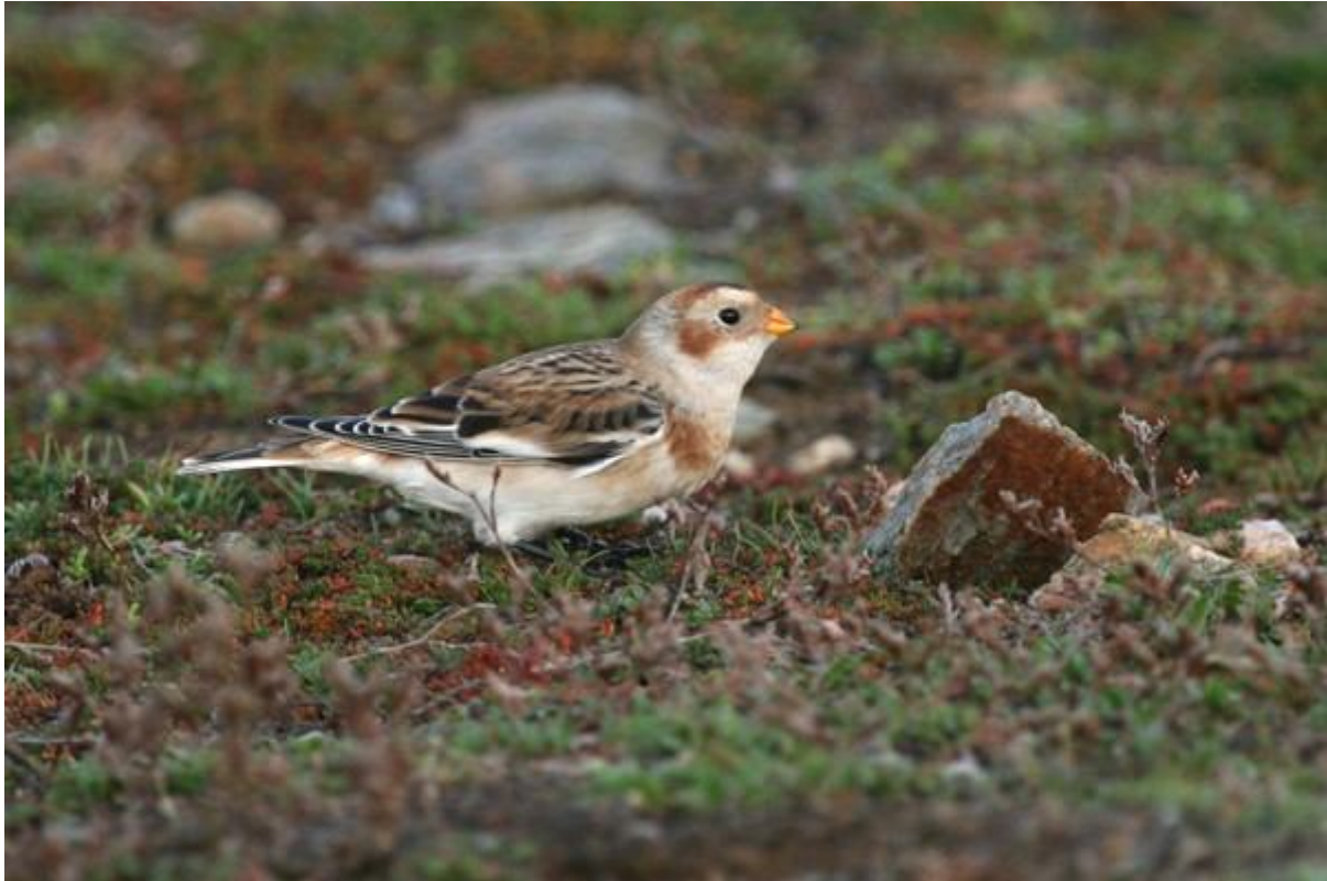
Bruant des neiges, pointe Saint-Gildas / Préfailles (Willy Raitière)