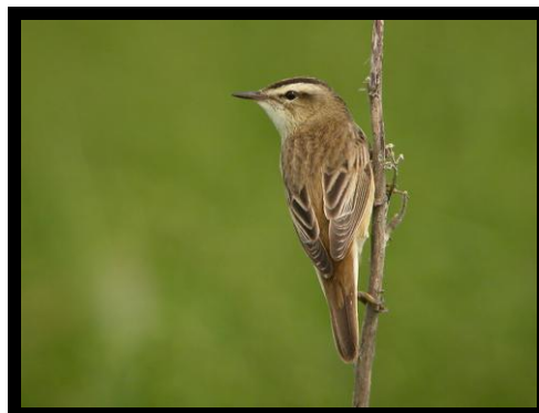
Phragmite des joncs