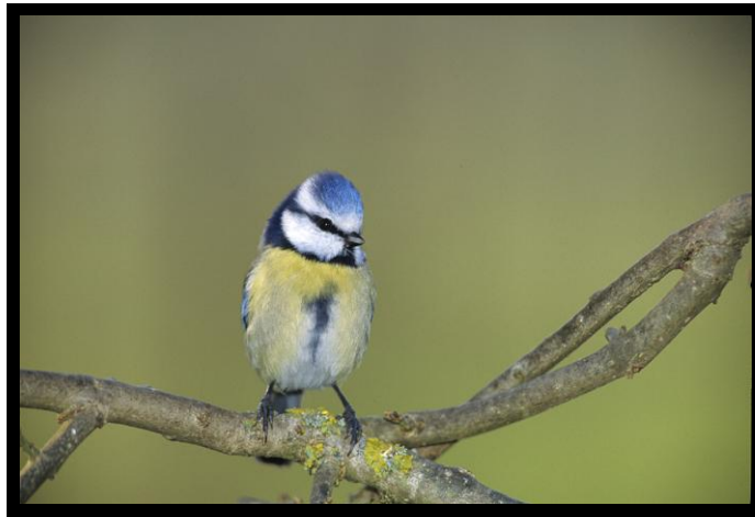
Mésange bleue

Mésange charbonnière ( Parus major ) : Janv. Fév. Mars. Avril Mai Juin Juil. Août Sept. Oct. Nov. Déc.