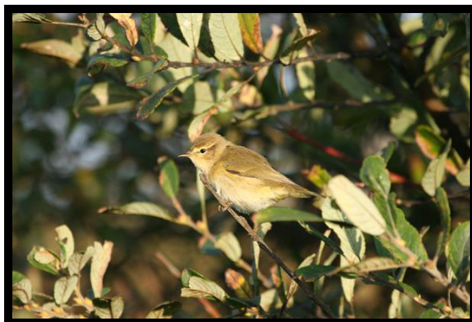
Pouillot véloce

Pouillot fitis ( Phylloscopus trochilus ) : Janv. Fév. Mars. Avril Mai Jun Juil. Août Sept. Oct. Nov. Déc.