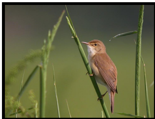
Rousserole effarvate