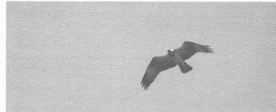
Balbuzard Pêcheur

- Peu de "raretés" à "se mettre sous la dent" : un faucon pèlerin le 29/9; 15 grues cendrées seulement en 2 vols : 7 le 8/10 et 8 le 21/10. Il est vrai que le Forez