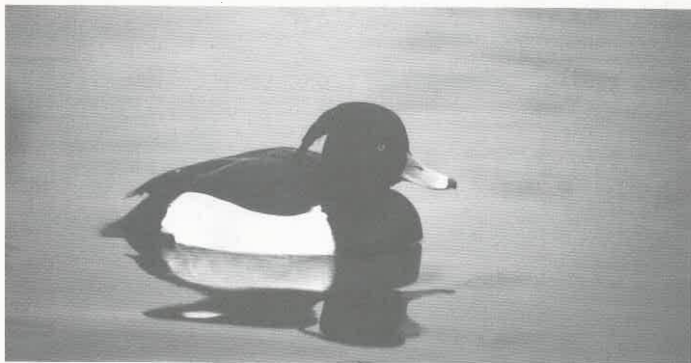
Fuligule morillon (JF.Pont)