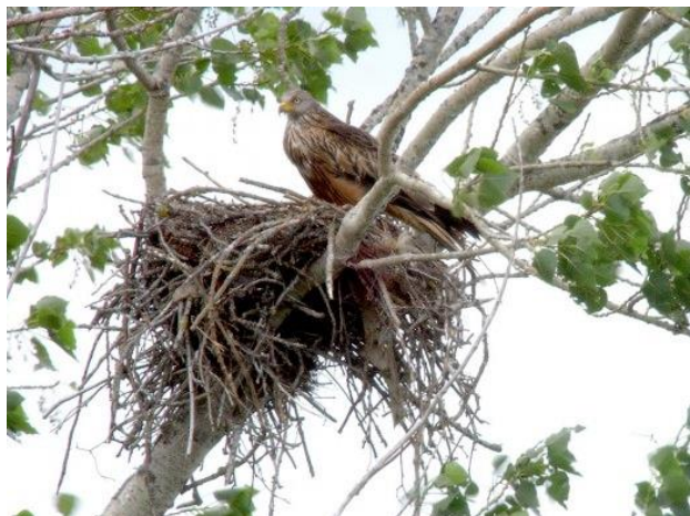
Nid de Milan Royal