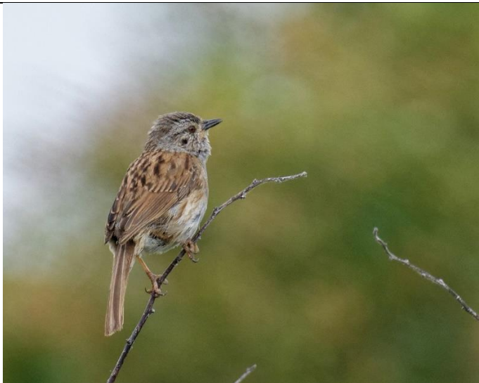
Accenteur mouchet Corps marron avec tête grise Chant puissant