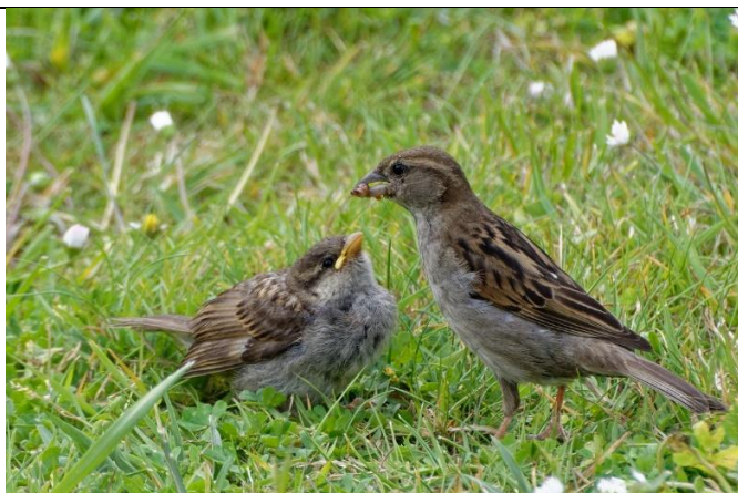
Moineau domestique – Femelle (avec un jeune) Dessous du corps gris – dessus marron-noir-jaune (Peut être confondue avec l'Accenteur mouchet)

Ventre jaune avec une ligne noire peu importante Dessus de la tête bleue