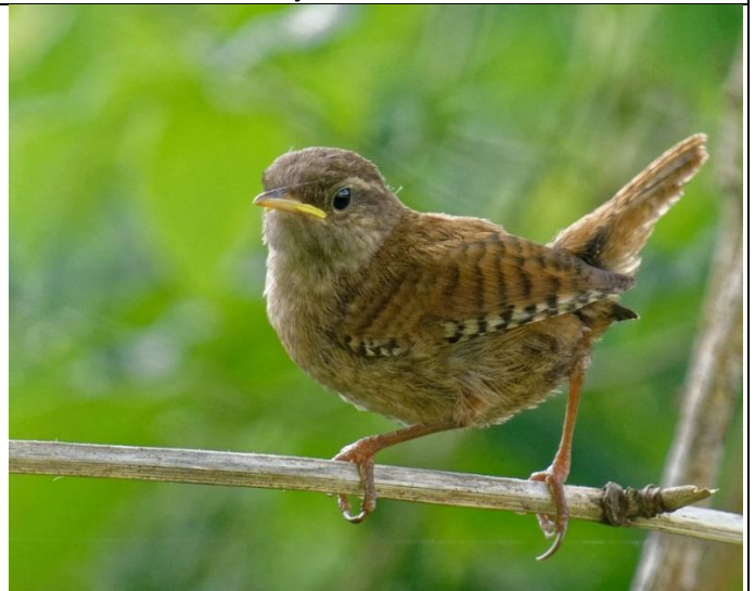
Troglodyte mignon (jeune ici) Couleur gris-marron Queue courte relevée