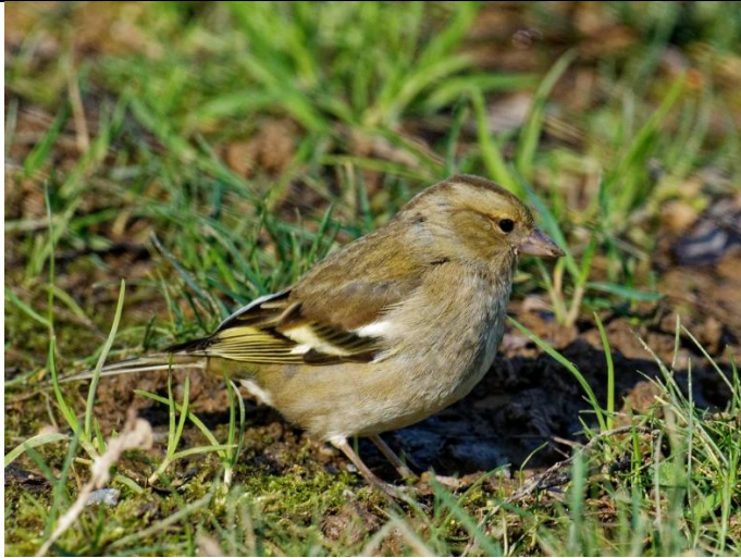
Pinson des arbres – Femelle Couleur gris jaunâtre Barre jaune pâle sur les ailes