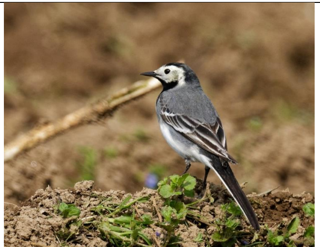
Bergeronnette grise Bavette (tache sous le bec) noire Longue queue toujours en mouvement