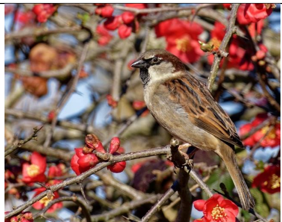
Moineau domestique – Mâle Bavette (sous le bec) noire Tête marron foncé et grise bien contrastée