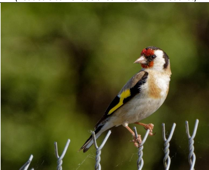
Chardonneret élégant Face avant de la tête rouge Barre jaune sur l'aile