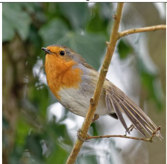
Rougegorge familier Tête et poitrail orange