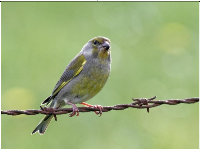
Verdier d'Europe Gris avec des teintes jaune-vert bien marquée surtout chez le mâle