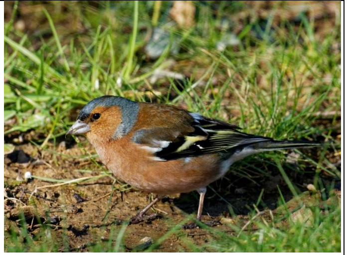
Pinson des arbres – Mâle Tête grise et orange Poitrail orange Barre jaune sur les ailes