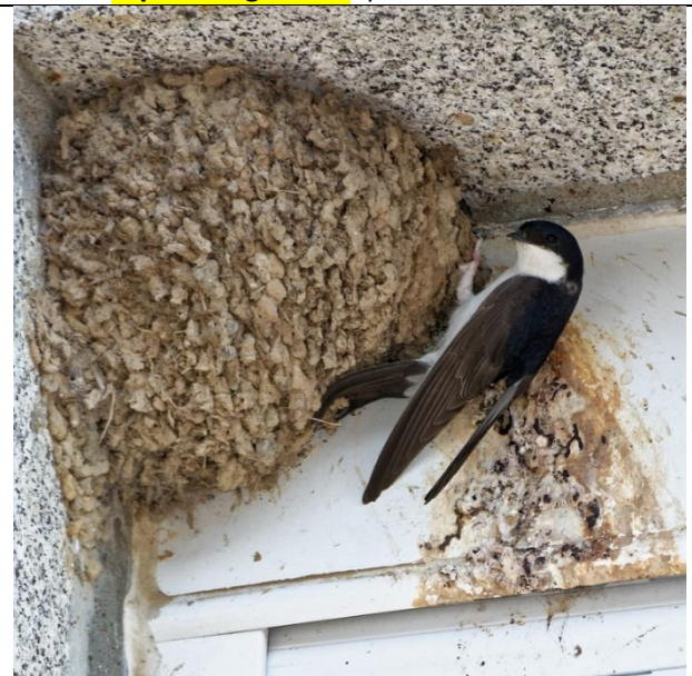
Hirondelle de fenêtre

Espèce migratrice qui arrive en mars - avril