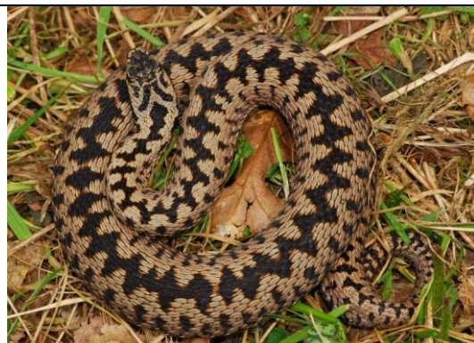
Vipère péliade : triangles marron ou noirs reliés

7B- marques dorsales en forme de triangle plus ou moins alternés, reliés les uns aux autres par une ligne médiane dorsale, museau arrondi, 2 rangées d'écailles entre l'œil et la bouche, iris cuivré ou orangé \Rightarrow Vipère péliade ( Vipera berus )