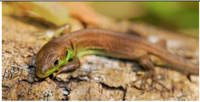
Jeune Lézard vert occidental (marron avec gorge verte)

4A- individu petit, trapu avec des pattes assez courtes, couleur marron (parfois gris) assez uniforme avec des ponctuations ou tirets noirs et blancs à jaunâtres ⇒ Lézard vivipare ( Zootoca vivipara )