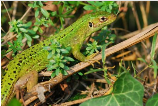
Lézard vert occidental adulte

3B- animal avec du vert sur le dos ou sous la gorge ⇒ Lézard vert occidental ( Lacerta bilineata )