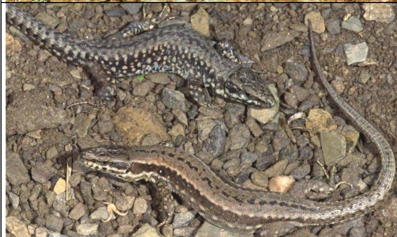
Lézard des murailles :

Pattes courtes, aspect trapu. Couleur assez uniforme avec des petits points noirs ou jaunâtres