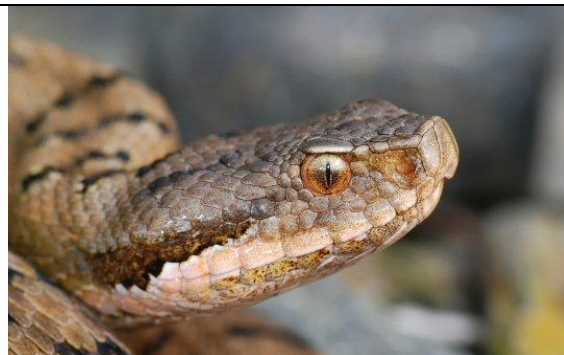
Tête de Vipère aspic

7B- marques dorsales en forme de triangle plus ou moins alternés, reliés les uns aux autres par une ligne médiane dorsale, museau arrondi, 2 rangées d'écailles entre l'œil et la bouche, iris cuivré ou orangé \Rightarrow Vipère péliade ( Vipera berus )