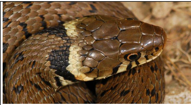
Couleuvre à collier

8A- corps le plus souvent gris avec présence d'un collier au niveau du cou de couleur noir et jaune (blanc à orange), ventre noir et blanc ⇒ Couleuvre à collier ( Natrix natrix )