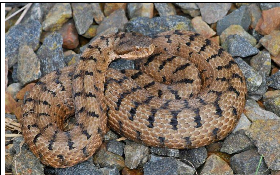
Vipère aspic : barres noires dorsales

7A- marques dorsales en forme de barres plus ou moins alternées, le plus souvent non reliées les unes autres par une ligne médiane dorsale, museau retroussé, 3 rangées d'écailles entre l'œil et la bouche, iris jaunâtre \Rightarrow Vipère aspic ( Vipera aspis )