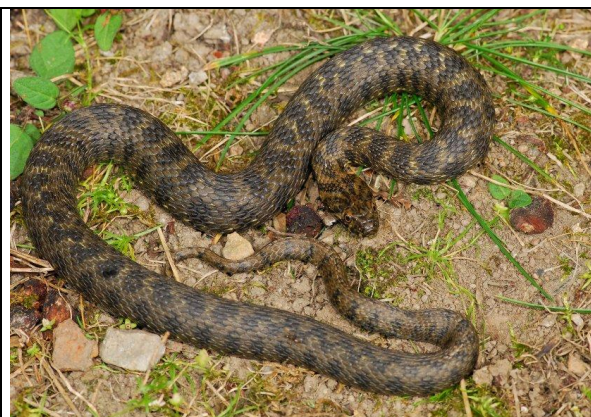
Couleuvre vipérine : souvent du jaune et des marques noires sur le dos mais peu nettes

8D- œil assez grand, présence de taches jaunâtres et noirâtres sur le dos ⇒ Couleuvre vipérine ( Natrix maura )