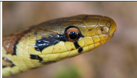
Jeune Couleuvre d'Esculape : tâche jaune au niveau du cou et marque noire sous et derrière l'œil

8C- couleuvre marron clair jaune olivâtre à marron très foncé avec des mouchetures blanches, ventre uniformément jaune ou blanchâtre, présence d'un collier jaune chez les jeunes (sans le noir de la couleuvre à collier) mais avec une tache noire sous et juste derrière l'œil qui disparaît chez l'adulte ⇒ Couleuvre d'Esculape ( Zamenis longissimus )