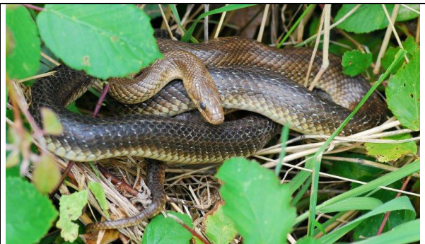
Couleuvre d'Esculape adulte

8D- œil assez grand, présence de taches jaunâtres et noirâtres sur le dos ⇒ Couleuvre vipérine ( Natrix maura )