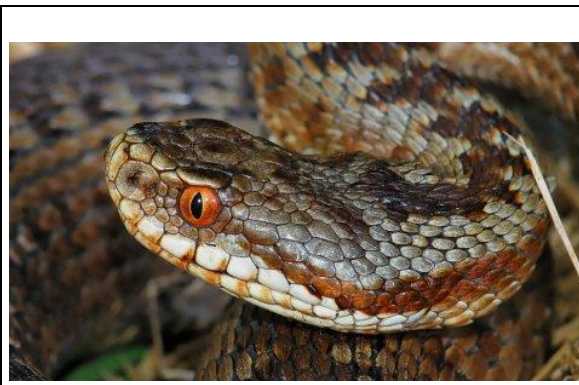
Tête de Vipère péliade