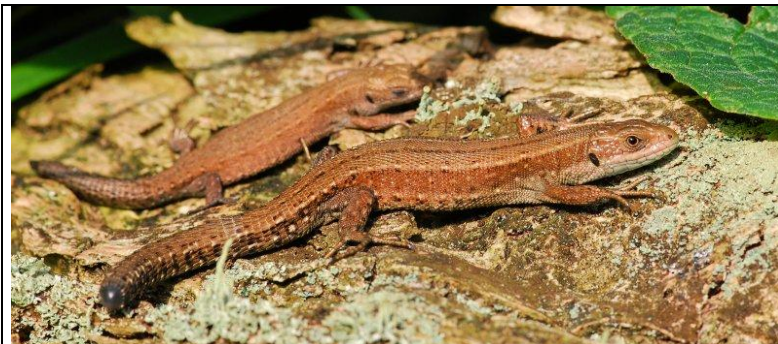
Lézard vivipare :

4B- individu svelte avec des pattes assez longues, de couleur grise avec quelquefois les flancs marron ou des petits points bleus sur les côtés ⇒ Lézard des murailles ( Podarcis muralis )