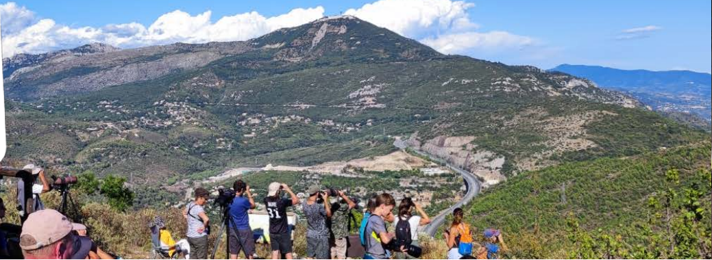
Camp de migration 2021 - PND de la Grande Corniche