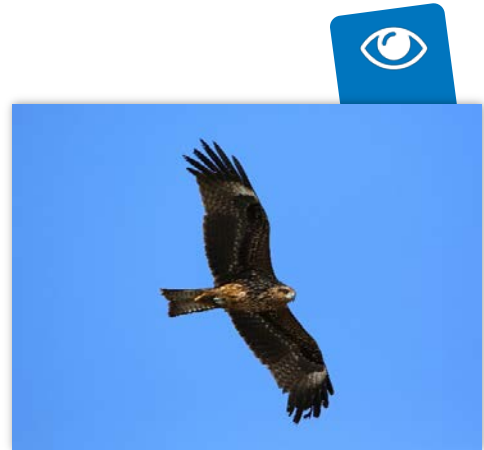
Milan noir

Au total, le suivi 2021 de la migration post-nuptiale aura permis de comptabiliser 31 648 oiseaux migrants depuis le poste d'observation aménagé sur le Parc naturel départemental de la Grande Corniche.