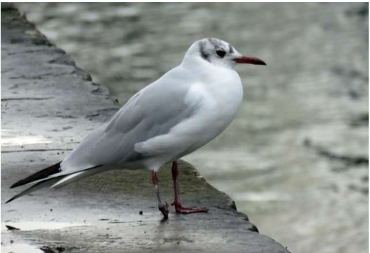
Mouette rieuse, pont de l'Université, Lyon, 31 janvier 2020, D. TISSIER. A noter que cet oiseau est très probablement le même que celui vu avec le même handicap et exactement au même endroit le 20 janvier 2019. Il aurait donc survécu au moins un an avec cette patte déformée.