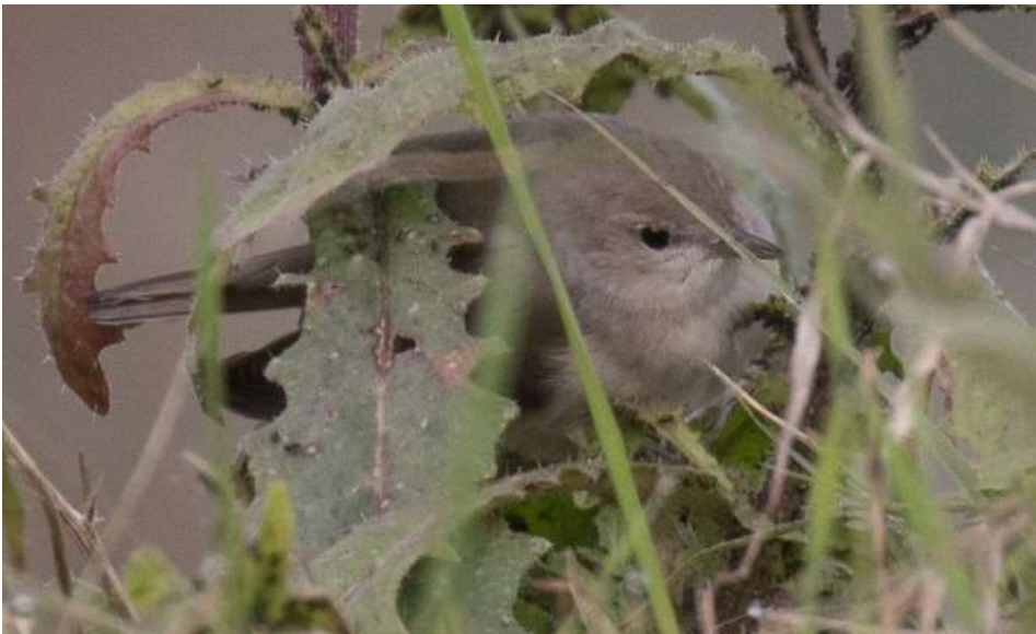
Fauvette des jardins, Anse, novembre 2019, Guillaume BROUARD

Une Fauvette des jardins Sylvia borin est observée à Anse (G. BROUARD) le 20 novembre, date extrêmement tardive pour l'espèce qui ne s'attarde guère au-delà de septembre en France ! A rapprocher de cette citation d' Hirondelle rustique Hirundo rustica vue le 17 novembre au Grand Large (P. ADLAM) !!!