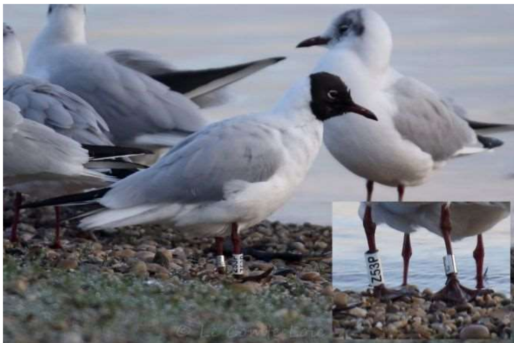
Mouette rieuse, Z53P, Miribel-Jonage, février 2020, Loïc LE COMTE. Noter que la bague semble encore en parfait état après près de 5 ans !

Un adulte au gué du Morlet (Miribel-Jonage) le 18 février 2020 (L. LE COMTE). Bague blanche au tarse droit – code Z53P noires. Origine : République tchèque – mâle bagué poussin le 1 er mai 2015 – 1095 km. Cette mouette avait été vue au même endroit et par le même observateur le 20 janvier 2017 ! ↓