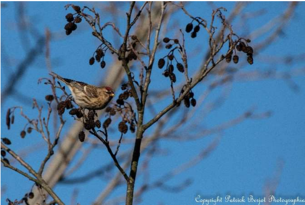
Sizerin cabaret, Anse, janvier 2020, Patrick BERJOT

Un autre est noté le 8 février (donc hors période) à Marchampt (C. FREY) et un à Miribel-Jonage le 23 (L. LE COMTE).