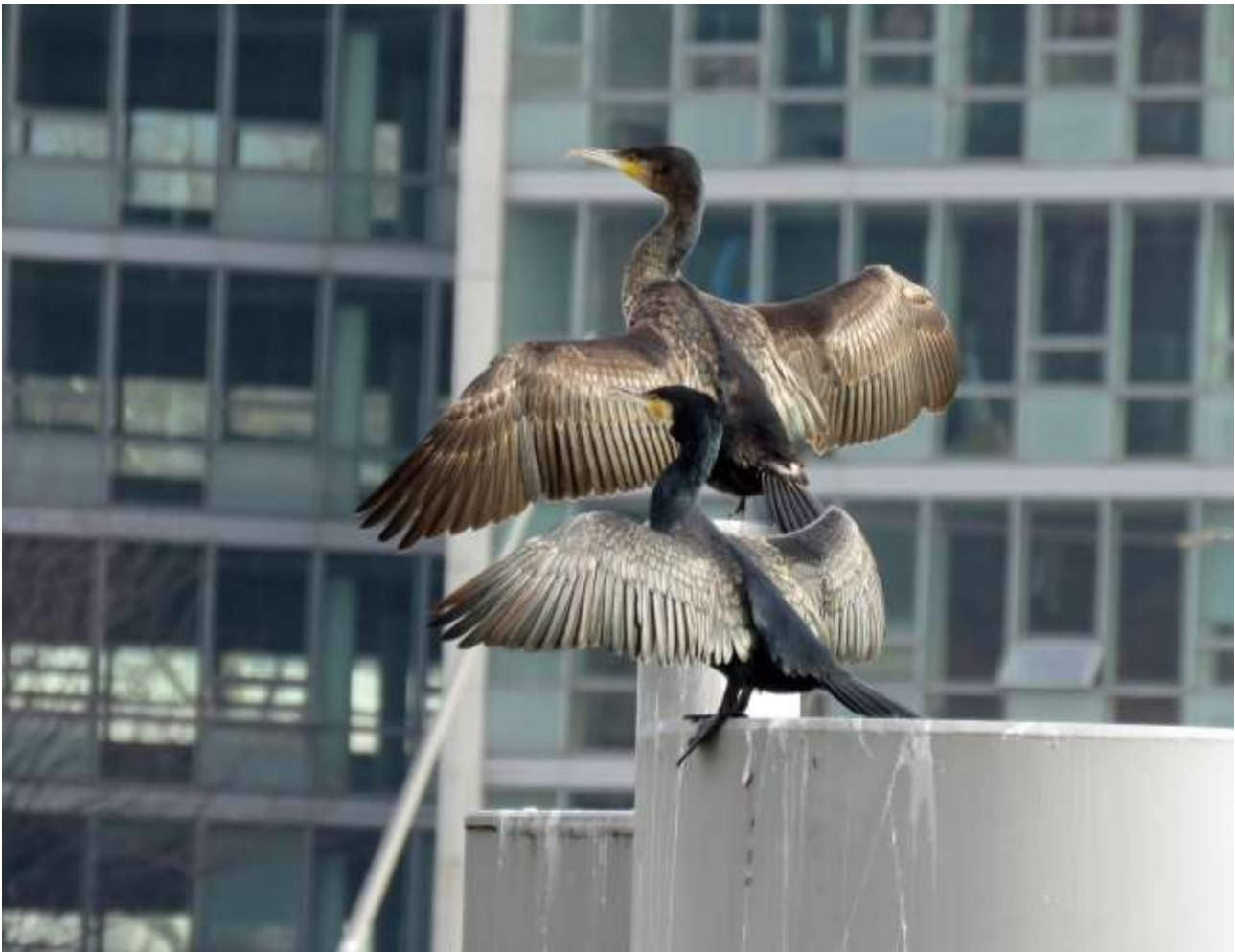
Grands Cormorans, Lyon Confluence, février 2020

Un mot pour terminer sur le comptage des Grands Cormorans Phalacrocorax carbo réalisé le 4 janvier 2020 sous le pilotage de Christian NAESSENS : 2145 oiseaux ont été comptés en 17 dortoirs situés principalement le long du Rhône et de la Saône. L'effectif évolue peu (-3% par rapport à l'année dernière). Merci aux nombreux participants bénévoles qui permettent le suivi de cette espèce, parfois décriée à tort !