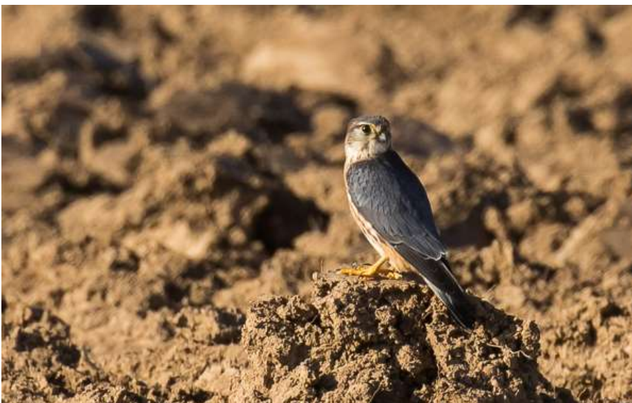
Faucon émerillon, mâle, Quincieux, janvier 2020, Guillaume BROUARD

Ces petites rapaces chassent souvent les Alouettes des champs Alauda arvensis encore assez nombreuses dans ces milieux ouverts.