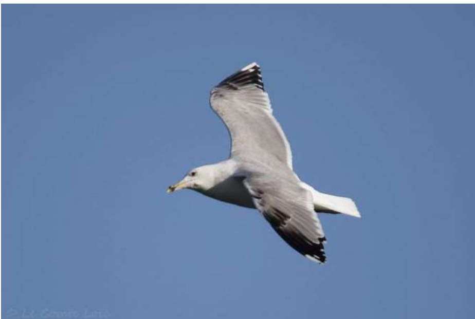
Goéland pontique, Grand Large, février 2020