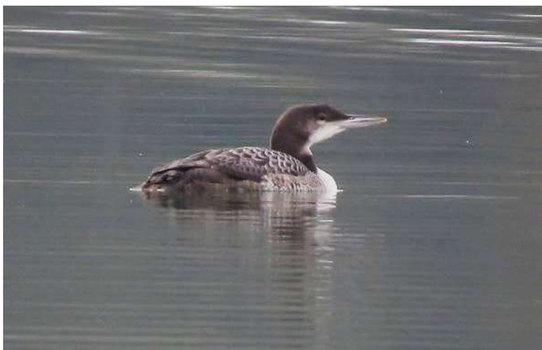
Plongeon imbrin, Anse, novembre 2019, Jean-Paul RULLEAU

Notons que ces fils ou filets de pêche causent beaucoup de dégâts, comme on a pu le voir à Lyon sur des Mouettes rieuses Chroicocephalus ridibundus survivant avec une patte coupée (voir en fin de chronique), des Cygnes tuberculés Cygnus olor , ou même une Grande Aigrette Ardea alba et un Grand Cormoran Phalacrocorax carbo , retrouvés morts, pendus à des arbres ! C'est sûrement pour une autre cause, mais un Oedicnème criard Burhinus oedicnemus avait le même handicap, sans doigts à la patte gauche, à Genas.