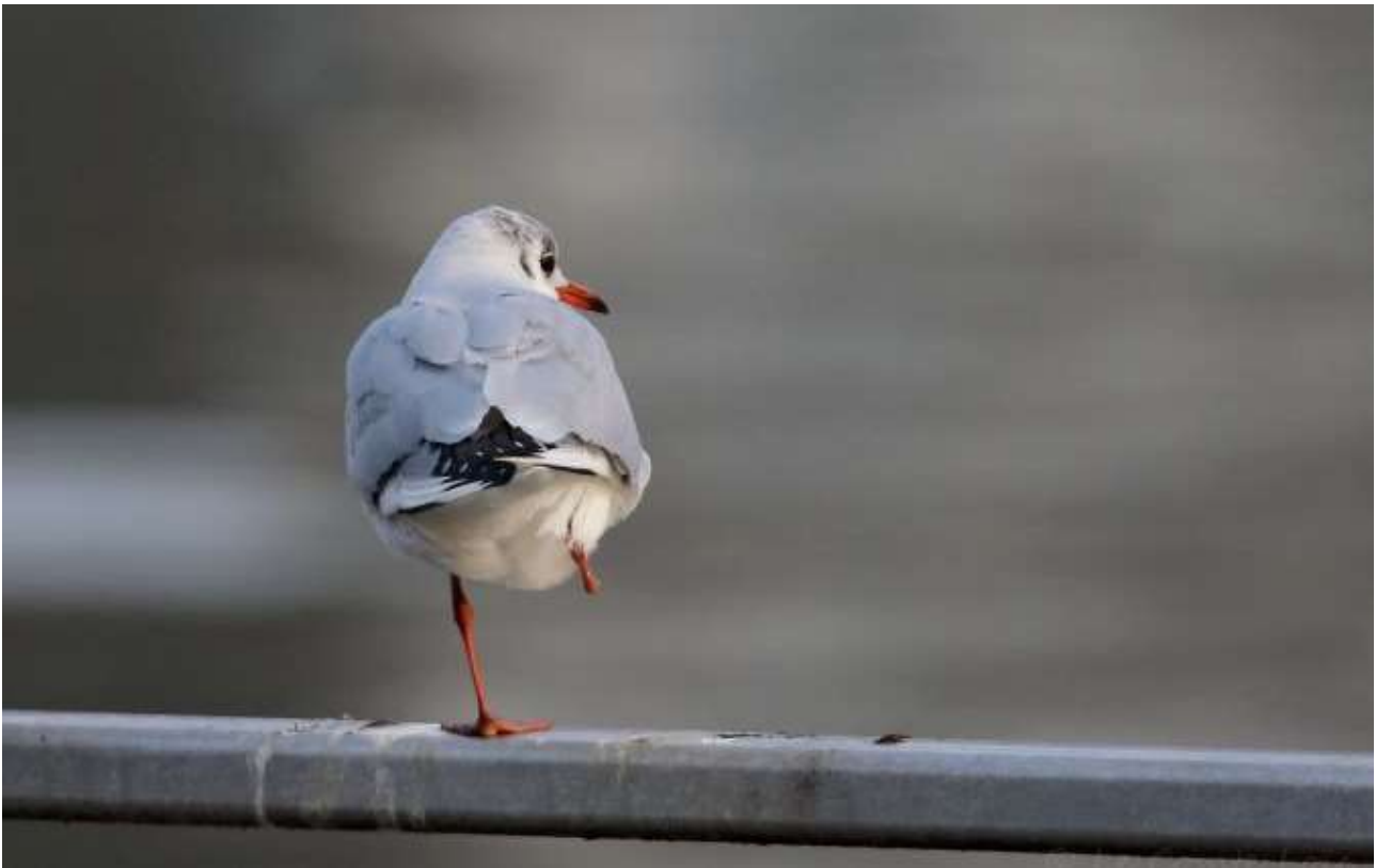
Mouette rieuse, pont Mazaryk, Lyon, 5 décembre 2019, Loïc LE COMTE. L'oiseau a une patte coupée. Trois autres adultes, également sans doigts à une patte ; et trois adultes et un immature ne pouvant poser une patte au sol (avec un problème d'articulation tarse-pied) ont été vus à la Confluence.