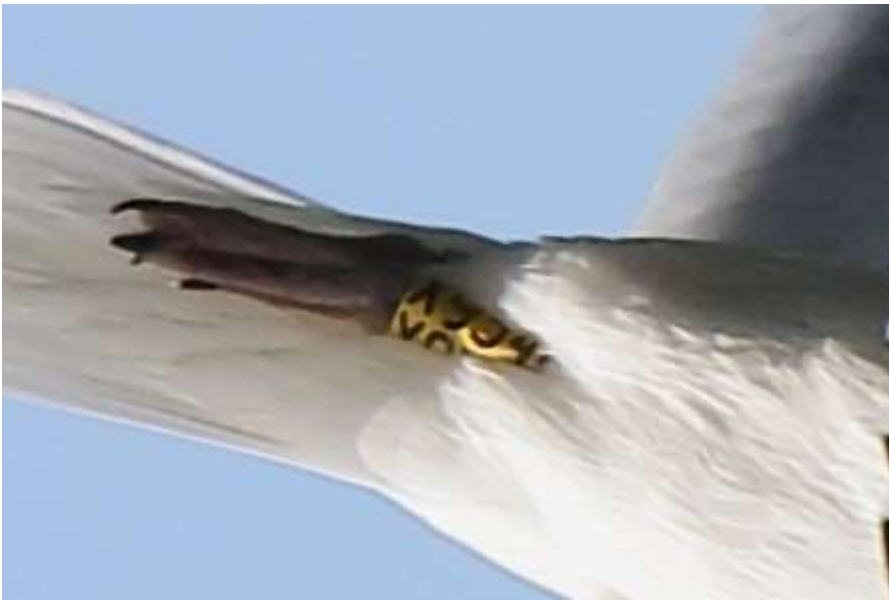
Goéland pontique, détail de la bague, Grand Large, février 2020, Loïc LE COMTE

Une Mouette mélanocéphale Larus melanocephalus de 1 er hiver est présente le 17 novembre à Miribel-Jonage (J.M. BELIARD). Mais pas d'autre citation !