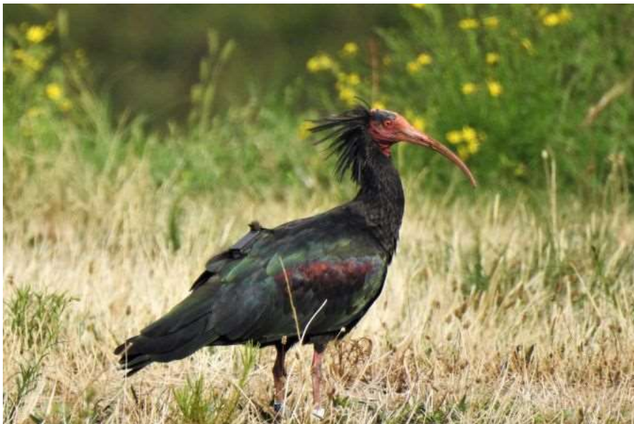
Ibis chauve, Saint-Andéol-le-Château, 20 septembre 2020, Olivier MOREL

Autrefois très répandue dans le pourtour méditerranéen, le Moyen-Orient, la Somalie et l’Ethiopie, ainsi que dans les Alpes, l’espèce, qui est surtout inféodée aux falaises littorales et aux parois rocheuses de montagne, est classée en danger critique d’extinction par l’UICN. Elle s’est éteinte en Europe au XVII e siècle, puis quasiment partout, suite à une chasse et des collectes d’œufs abusives, ainsi que du fait des modifications des milieux sauvages et de l’usage des pesticides. La petite population syrienne est considérée comme disparue suite à la guerre civile en cours. Les dernières populations sauvages (de l’ordre d’une centaine de couples) vivent au Maroc dans le parc national du Souss Massa.