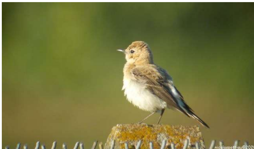
Traquet oreillard, Pusignan, mai 2020

Un Traquet oreillard* Oenanthe hispanica femelle a été observé le 21 mai à Pusignan (Kevin GUILLE et al. ) (voir l'article de Kevin GUILLE dans ce même numéro). Deuxième donnée départementale !