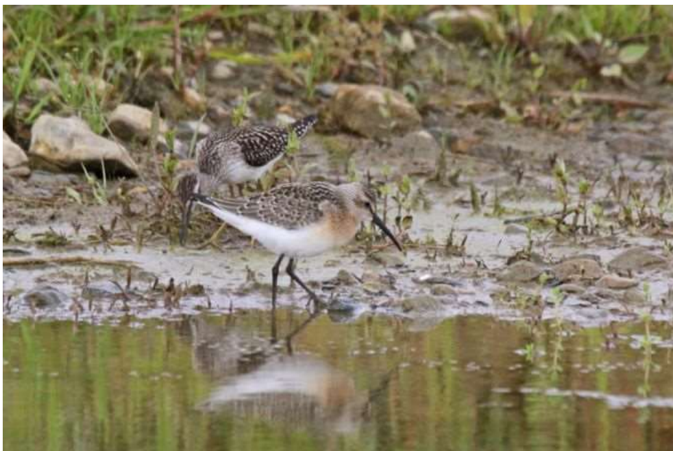
Bécasseaux cocorlis, Arnas, août 2020, Frédéric LE GOUIS

Deux Bécasseaux cocorlis Calidris ferruginea immatures sont notés à la gravière de Joux à Arnas (Frédéric LE GOUIS) le 22 août, avec plusieurs autres espèces de limicoles en transit.