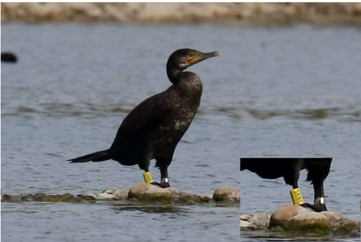
Grand Cormoran, Miribel-Jonage, 27 août 2020, Loïc LE COMTE

A propos d'oiseaux bagués, il faudra penser aussi à noter d'éventuelles bagues sur les laridés et autres hivernants éventuels de cet hiver. Un Grand Cormoran Phalacrocorax carbo séjourne depuis le 14 août au moins à la Droite ; il a été bagué SRHC au tarse droit à la Réserve biologique de Doñana (Espagne), située sur la côte sud, entre Huelva et Cadix, à environ 50 km à l'ouest de Gibraltar.