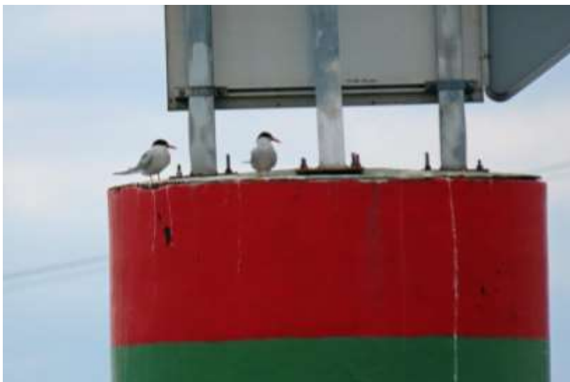
Sternes pierregarins, Lyon Confluence, juin 2020

A noter la présence tout à fait inhabituelle de deux adultes à la Confluence entre le 16 mai et le 7 juillet (Dominique TISSIER, Régis POULET), souvent posés sur une des balises qui séparent Saône et Rhône au confluent (photo ci-dessous). Avec même 5 individus le 30 juin. Apparemment non nicheurs, mais il faudrait prospecter du côté du port Edouard-Herriot !