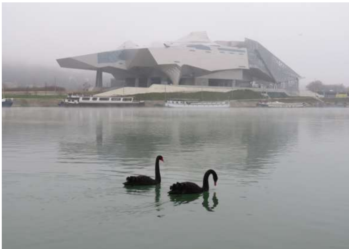
Cygnés noirs, Lyon Confluence, janvier 2020, D. TISSIER

À noter un adulte (de retour ?) à la carrière le 20 septembre (Anthony GUÉRARD).