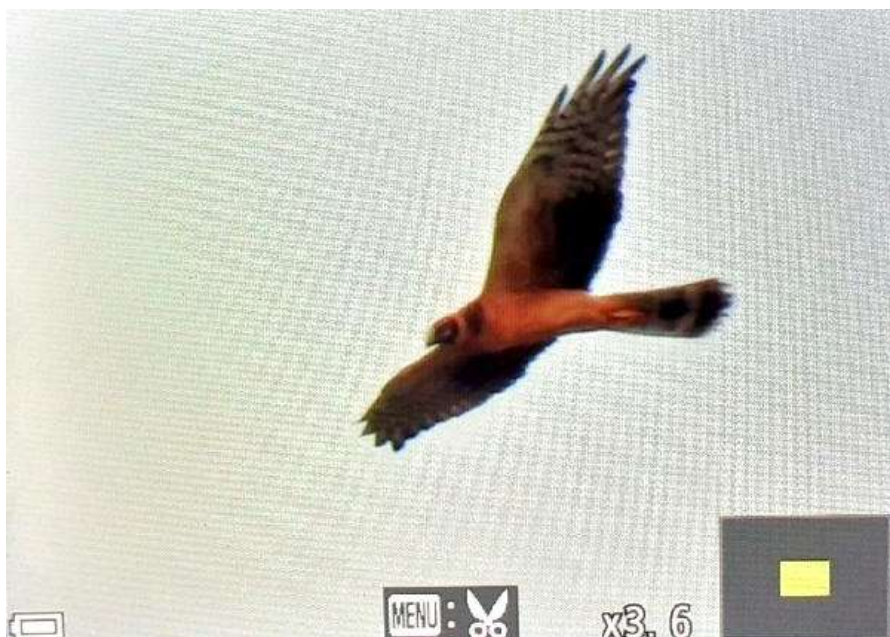
Busard pâle, 1 ère année, Saint-Andéol-le-Château, septembre 2020, Léandre COMBE

Belle observation d'un Busard pâle* Circus macrourus juvénile le 22 septembre à Saint-Andéol-le-Château (Léandre COMBE et Daniel DE SOUSA).