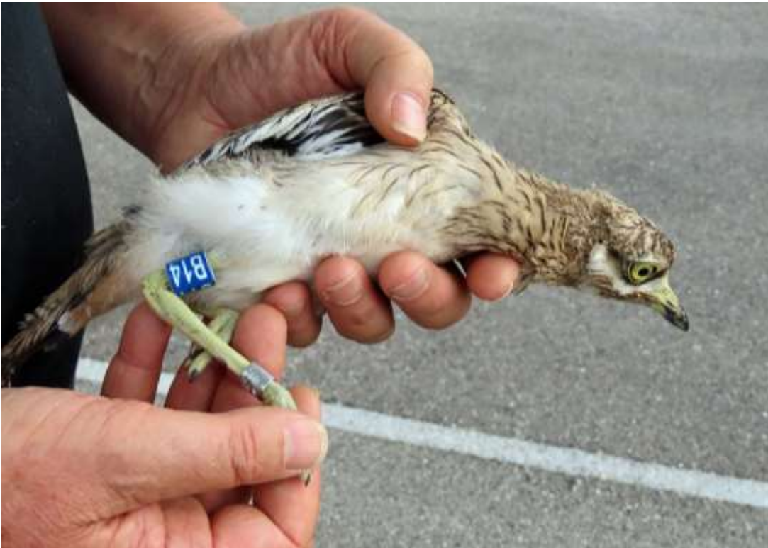
Cedicnème criard, Genas, août 2020, Arnaud LEDRU, Dominique TISSIER

Il s'agit de bagues bleues, avec un code alphanumérique blanc, sur les tibias, comme montré sur la photo ci-dessous. Plus d'informations, dont certaines très étonnantes, dans un prochain numéro !