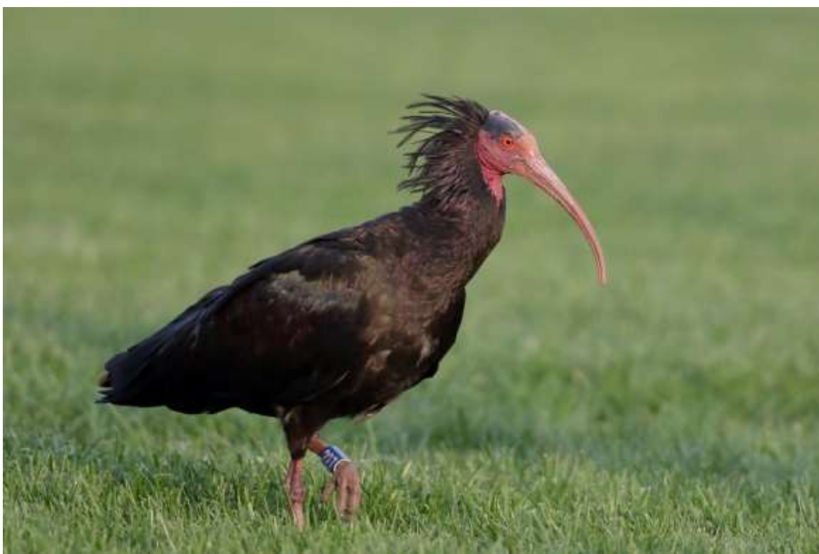
Le même oiseau photographié à Saint-Jean-de-Bournay (Isère) le 18 septembre

Pour mémoire, un immature, issu d'un programme de réintroduction autrichien, équipé d'un émetteur, avait survolé le Rhône entre le 12 et le 14 septembre 2011, mais sans être observé ( in LE COMTE & TISSIER 2019, page 253).