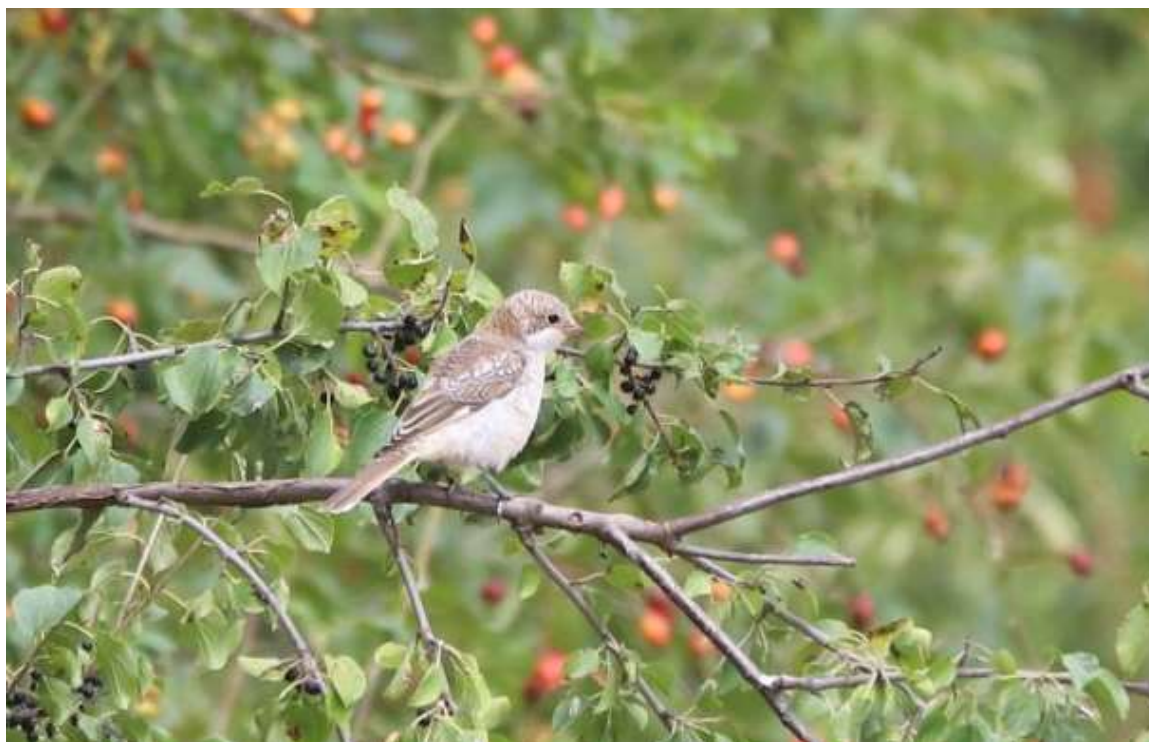
Pie-grièche à tête rousse, Genas, août 2020, Paul ADLAM

Une Pie-grièche à tête rousse Lanius senator est à Ouroux le 16 mai (Sonia QUEMENEUR-LEBLOIS) et une autre à Brussieu le 2 juin (Tom VELLARD). L'espèce ne niche plus dans le Rhône depuis 2010. Mais les dates de ces deux citations devraient nous inciter à plus d'attention sur d'éventuelles nidifications dans les Monts du Lyonnais et du Beaujolais. En période migratoire, un oiseau de 1 er année est observé à Genas le 30 août (Paul ADLAM).