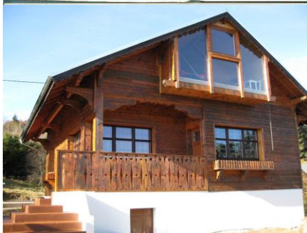
La Zygène ; 509, chemin des Treize-Arbres (079-953-5709)

Société Entomologique GE Muséum d'histoire naturelle Case postale 6434 1211 Genève 6