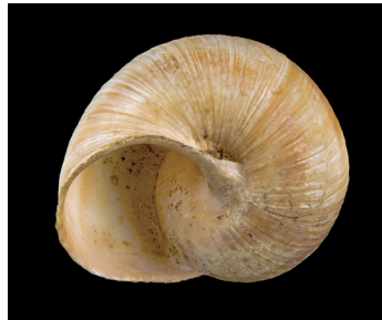
Vue de dessous