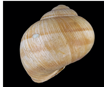
Vue de derrière