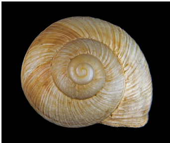
Vue de dessus