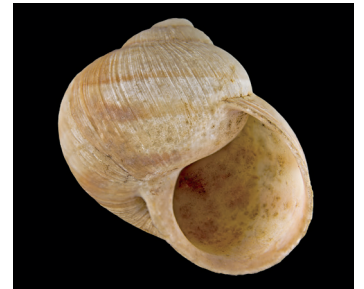
Vue de devant