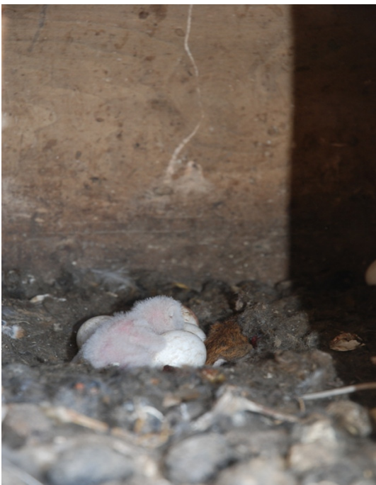
Poussin venant d'éclorre (Avusy - 2012)