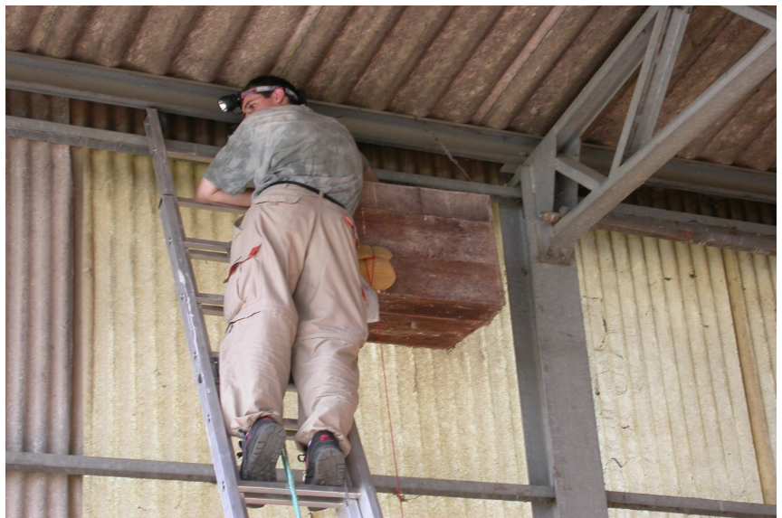
Contrôle d'un nichoir (Aire-la-Ville)