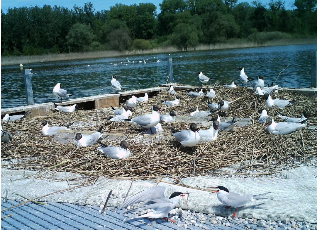
La montée des eaux a balayé les nids de mouettes laissant le champ libre aux sternes. Lac de Morat, le 10.05.2015