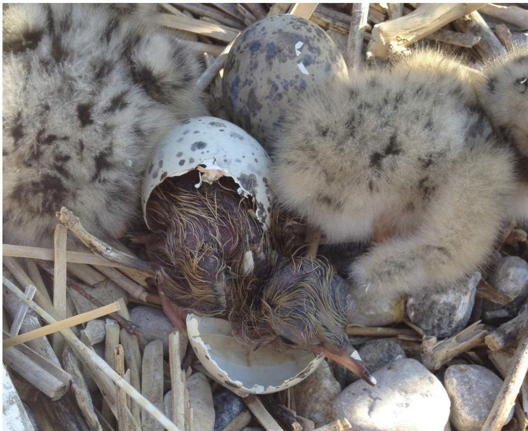
Une des dernières éclosions de sterne. Lac de Morat, le 21.07.2015