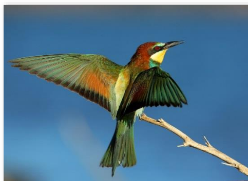
Guêpier d'Europe

Et pour cet oiseau coloré, emblème du Fort de la Revère, le Guêpier d'Europe, le pic de passage est prévu le samedi 5 et dimanche 6 septembre !