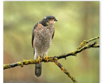
Epervier d'Europe © André Simon