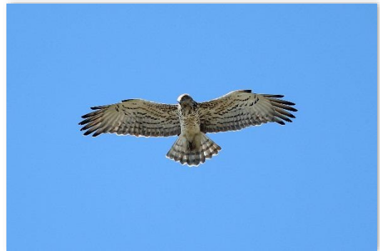
Circaète Jean-le-Blanc en chasse sur le site

La migration des rapaces s'amorce avec 6 Eperviers d'Europe, 23 Bondrées apivores, 1 Milan royal, 2 Busards des roseaux, 2 Faucons crécerelles et 3 Faucons hobereaux. Des observations d'individus locaux ont pu être réalisées : Circaète Jean-le-Blanc, Buse variable ou encore Perdrix rouge et Fauvette mélanocéphale.