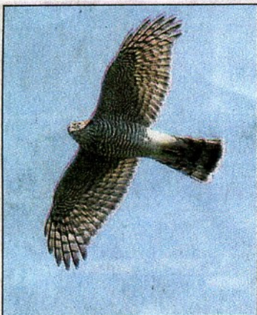
Un épervier d'Europe.