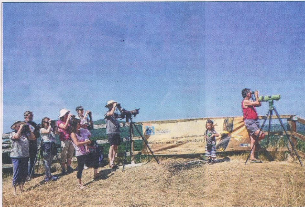
■ Superbe spectacle pour les amis de la nature.

Pas encore de réelles migrations en ce 15 juillet mais quelques sympathiques observations, martinets, hirondelles de fenêtre et rustique, un faucon hobereau à la chasse aux insectes, faucons crécerelle et buses variables,