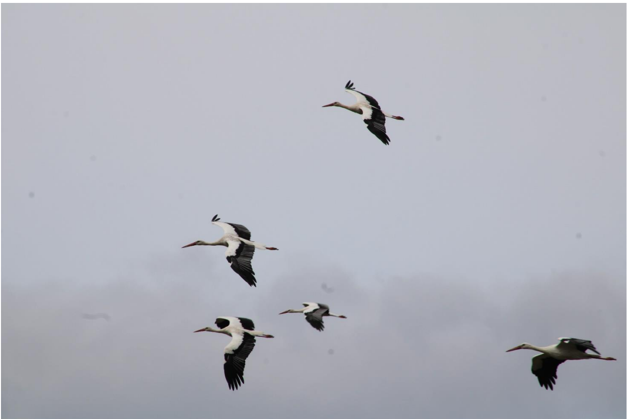
Cigognes blanches en migration

Lors de ces trois journées, nous dénombrons 84% de l'effectif total saisonnier. La fin du mois est marquée par de belles journées pour les bondrées apivores Pernis apivorus , et les cigognes blanches Ciconia ciconia . En effet, le 30 et le 31 août, 8021 bondrées passent sur le Roc (80% de l'effectif saisonnier), et 4103 cigognes (60% de l'effectif saisonnier) .