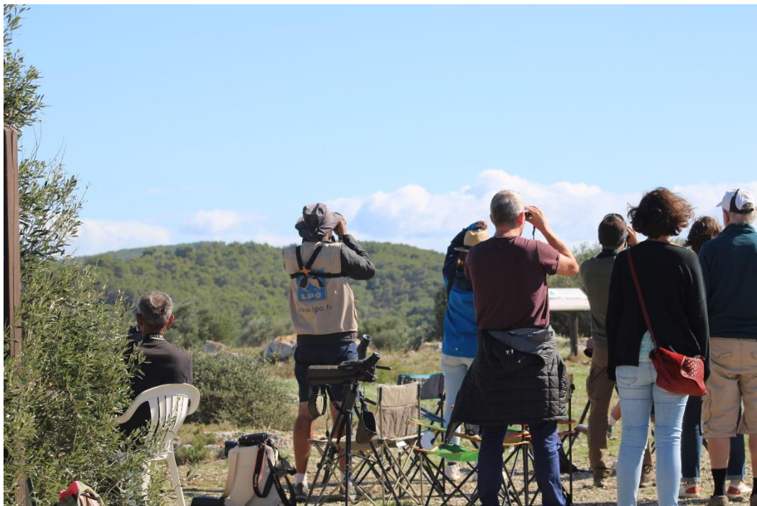
Observateurs présents sur le Roc de Conilhac