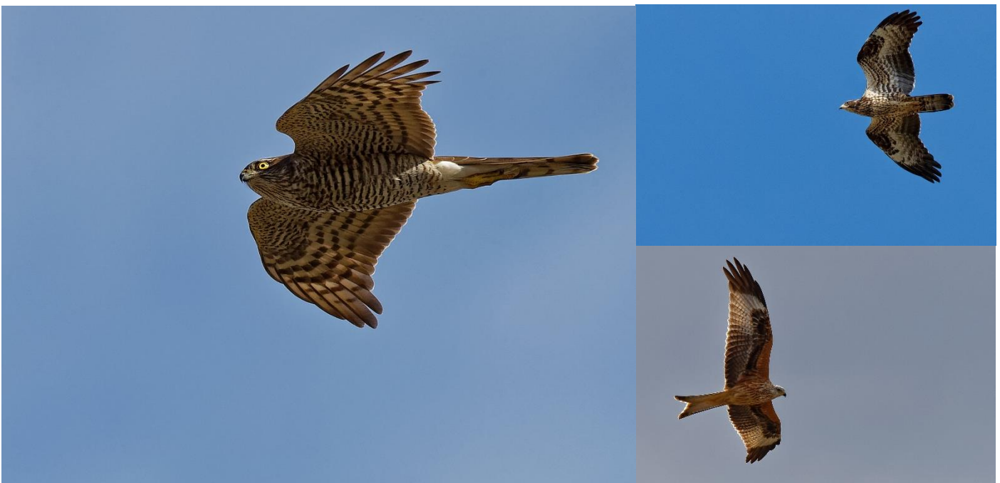
Photo de couverture (de gauche à droite et de haut en bas) : Epervier d'Europe, Bondrée apivore et Milan royal