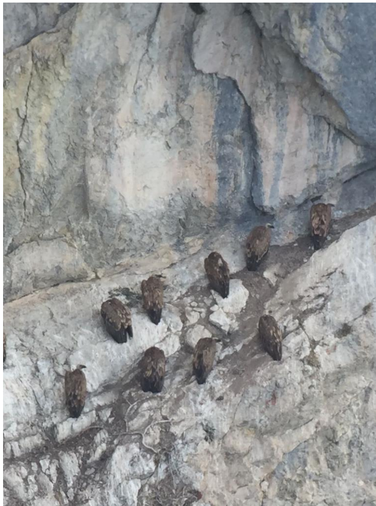
Extrait du dortoir (photo faite à travers une longue-vue)

Seule autre observation de vautours: 2 individus à 17h00 près de la croix du Schafberg où les nuages ont ensuite couvert la vue. A 17h56, il ne restait plus qu'un individu et à 18h30 il n'y avait plus de vautour visible au Schafberg. Nous pensons que ces deux oiseaux ont rejoint les autres au dortoir.