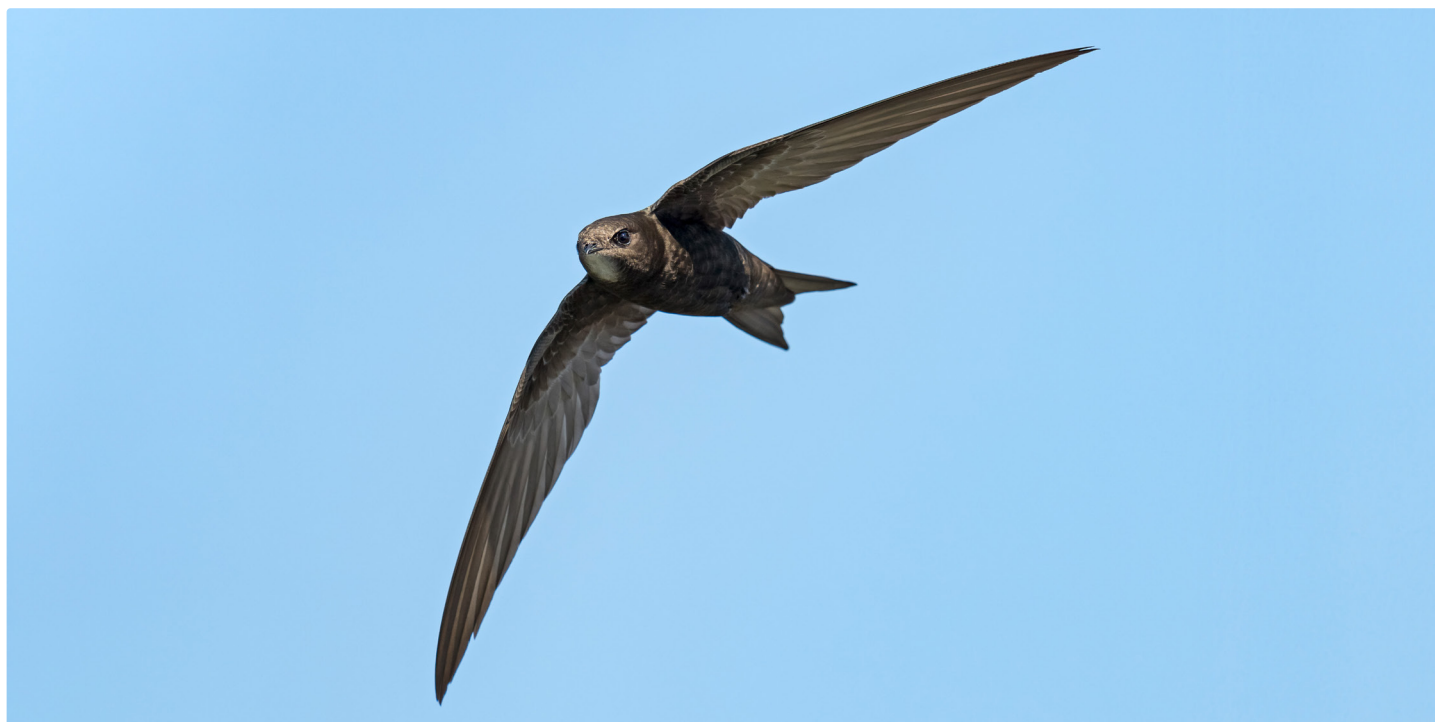
Martinet noir