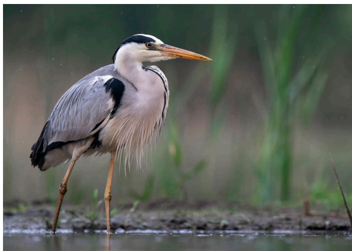
Peu farouches, les hérons cendrés investissent parfois aussi les mares des parcs et jardins.