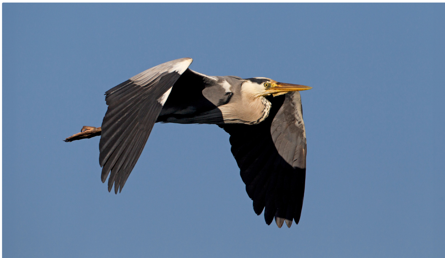
Héron cendré