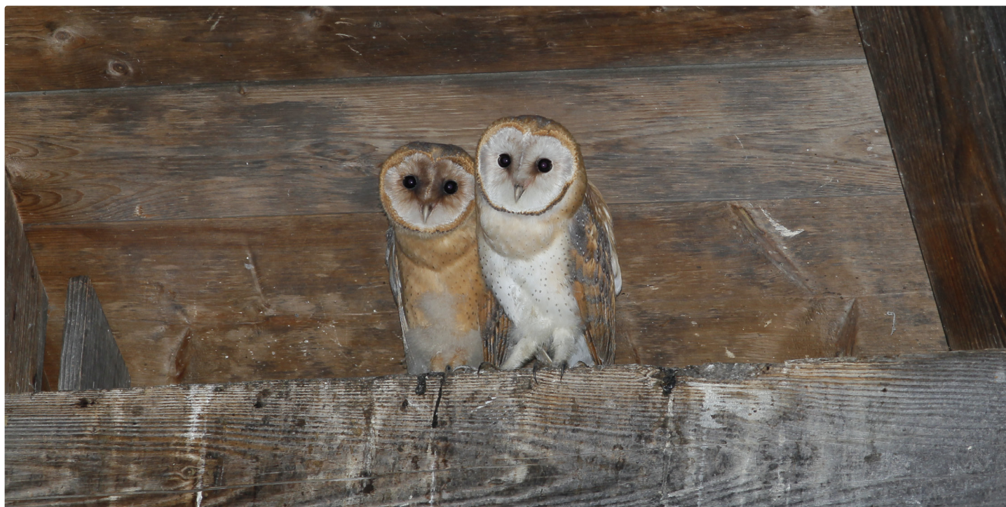
Effraies des clochers