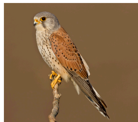
Les nichoirs profitent au faucon crécerelle.

Dans la mesure du possible, nous recommandons d'accrocher le nichoir sur la paroi interne du bâtiment, où il sera mieux protégé des intempéries et des curieux. Ainsi, il sera aussi à l'abri des fouines et l'accès pour son contrôle et son nettoyage en sera facilité. Ce montage nécessite cependant un trou de 15 x 20 cm dans la paroi. Le nichoir doit être fixé à au moins 4 mètres au-dessus du sol.