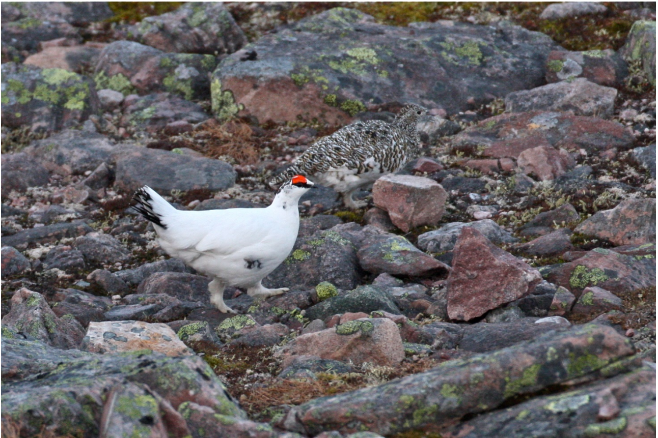
Le Lagopède alpin, ici un couple, est une espèce Suisse menacée. Elle est pourtant toujours chassable