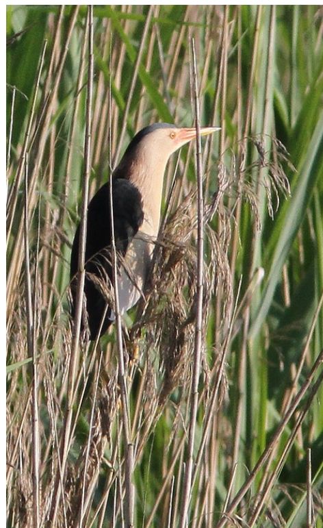
Blongios nain (G.Bedrines)

Ainsi, cet ardéidé est aujourd'hui classé "quasi menacé" en France, et "en danger" en Bourgogne, d'après les Listes Rouges respectives.