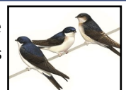
Hirondelle de fenêtre

Elle se différencie du Martinet noir car ce dernier a un plumage complètement sombre. De plus, il est plus grand et a des ailes pointues plus larges à la base.