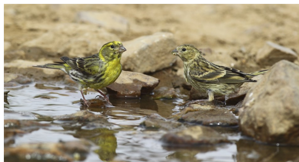
Mâle (gauche), Femelle (droite)

Mâles, femelles et juvéniles sont différents. La femelle est moins jaune et plus rayée que le mâle.