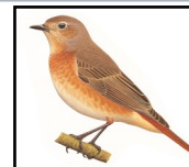
Rougequeue à front blanc (femelle)

Pour le mâle la confusion est possible avec la Sittelle torchepot au niveau des couleurs (gris, noir, poitrine chamois). Pour la femelle, c'est avec la femelle du Rougequeue à front blanc ou la femelle du Tarier pâtre qu'il peut y avoir confusion en raison des couleurs (dos gris-brun et ventre chamois).