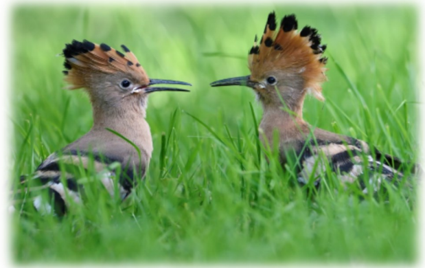
Huppes fasciées juvéniles