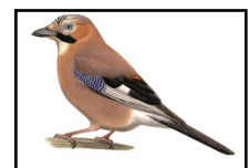
Geai des chênes

Il est possible de confondre la Huppe fasciée avec le Geai des chênes car ils sont de même taille. Cependant son bec est plus long, arqué et effilé et elle présente une huppe caractéristique permettant d'éviter toute confusion.