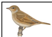
Fauvette des jardins

Comme le Gobemouche gris, la Fauvette des jardins présente un plumage grisâtre et uni. Vous les différencierez à leurs comportements très différents, ou à la taille de la queue, plus courte chez la Fauvette des jardins.