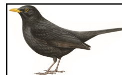
Merle noir mâle

Il peut être confondu avec le Merle noir , que l'on rencontre aussi facilement dans les jardins. Cependant, le merle est plus grand avec une queue plus longue. De plus, l'étourneau marche au sol alors que le merle sautille.