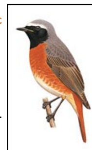
Rougequeue à front blanc

La confusion avec le Rougequeue à front blanc est fréquente mais le dessous du mâle est rouge-orangé et il possède un bandeau blanc caractéristique sur le front. La femelle de Rougequeue à front blanc est plus pâle sur la ventre et sa poitrine est beige plutôt que grise. Le Rougequeue à front blanc frétille moins de la queue.