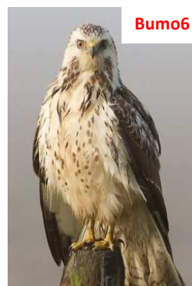
Biancastra, le copritrici sono ancora perlopiù scure