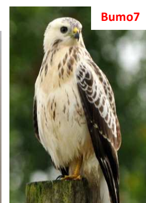
Generalmente bianca, testa chiara e collo variabile. Le copritrici sono bianche!