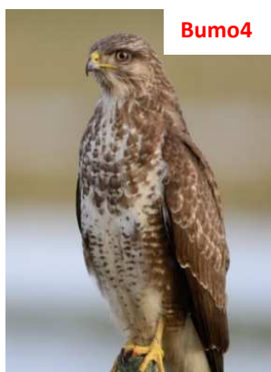
Banda chiara sul petto separa collo e ventre chiazzati, con testa e fianchi ancora scuri