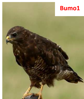
Completamente scura, (quasi) senza bianco