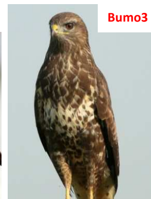
Banda chiara sul petto divide collo e ventre scuri