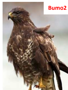
In generale scura, Poco bianco sul ventre