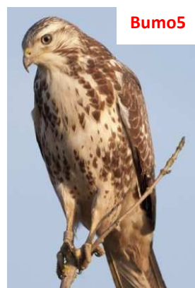
Il collo può essere chiaro e macchiettato, con testa chiara striata. Fianchi ancora scuri